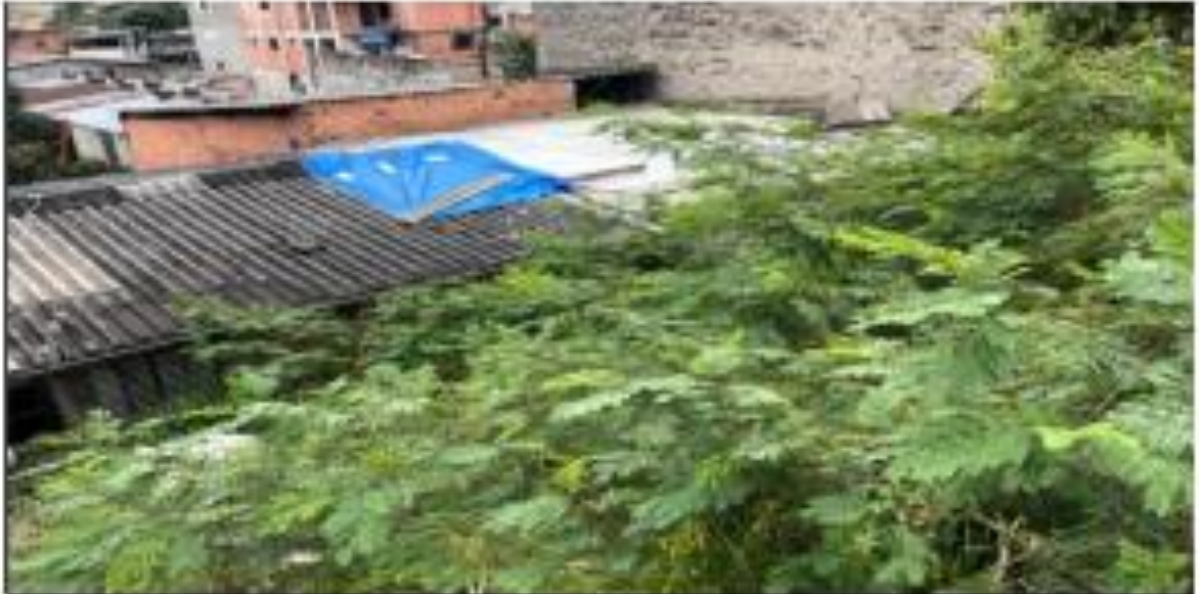
MURO DE ARRIMO EM DIVISA COM O VIZINHO