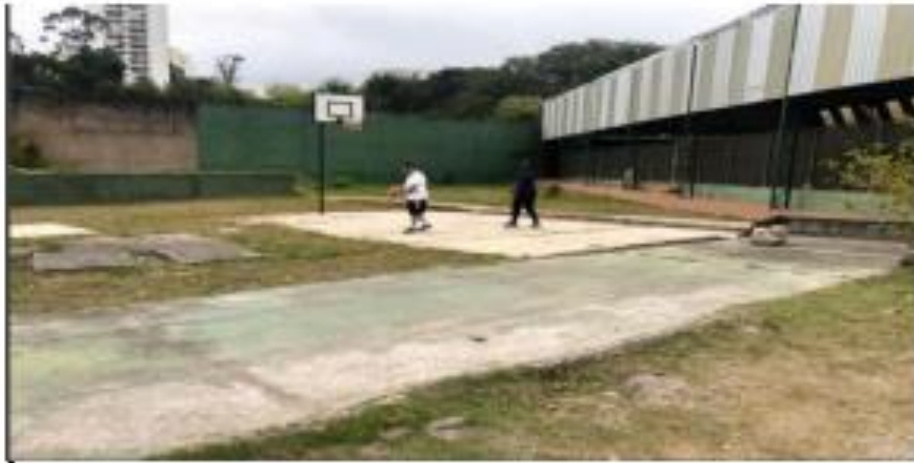
PISO DE CONCRETO A SER DEMOLIDO