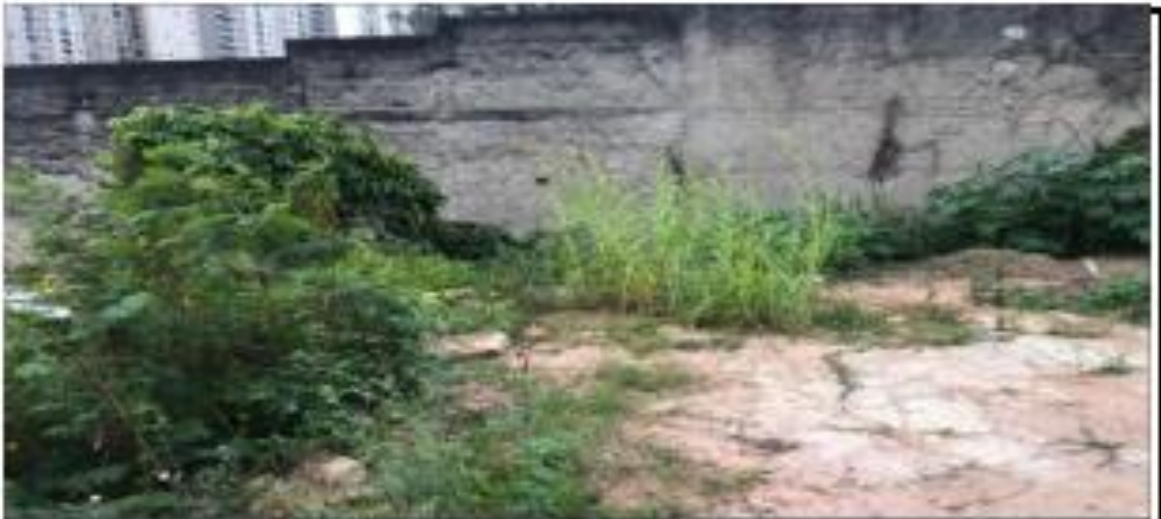
MURO DE ARRIMO EM DIVISA COM O VIZINHO