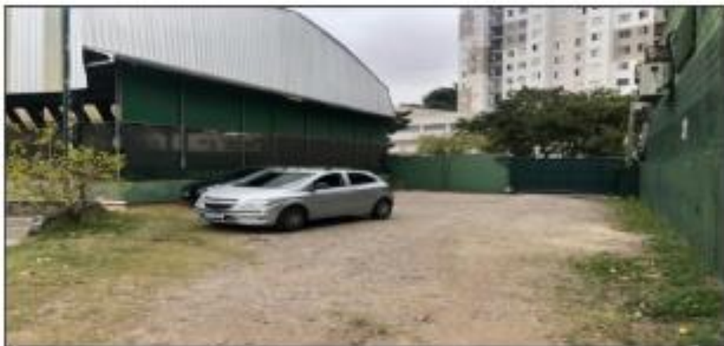
AREA DO ESTACIONAMENTO EM PISO PERMEAVEL