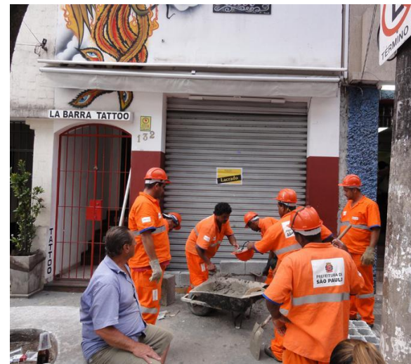
Legenda: Exemplo de fiscalização

Compete às Subprefeituras fiscalizar o cumprimento das normas municipais relacionadas com o código de edificações, zoneamento, abastecimento e posturas municipais. O trabalho consiste em orientar, fiscalizar e prestar informações ao público, sobre irregularidades em obras públicas e particulares. Em 2022, as principais ações fiscalizadoras solicitadas foram: 1ª Obras Particulares (30%); 2ª Carros Abandonados na via pública (27%); 3ª MPL – Muro/Passeio/Limpeza (14%); 4ª Posturas em Geral (8,65%); 5ª - Áreas Municipais (8,29%); 6º Atividade (7,09%).