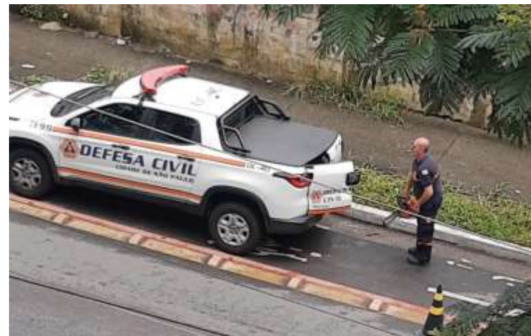
Legenda: Exemplo de ação de defesa civil

A atuação da Defesa civil tem o objetivo de reduzir os riscos de desastres. Também compreendendo ações de prevenção, mitigação, preparação, resposta e recuperação. Sempre que o cidadão sentir-se inseguro em relação a desastres naturais, enchentes, alagamentos, desmoronamentos, escorregamentos de terras, vazamentos de produtos químicos e combustíveis, ou exposto a situações de risco que exijam a atuação de profissionais, podem solicitar os serviços da defesa civil.