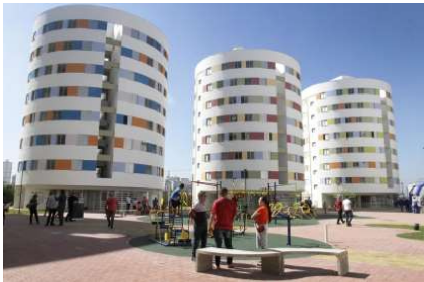
Legenda: exemplo de ação da SEHAB - Novas moradias do Heliópolis

A Secretaria Municipal da Habitação (SEHAB) é responsável por gerir e executar a Política Municipal da Habitação Social, promover a regularização Urbanística e Fundiária de Assentamentos Precários, Loteamentos e Parcelamentos Irregulares, mas a Subprefeitura pode apoiar o desenvolvimento dessas ações no seu território.