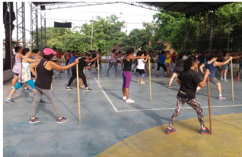
Legenda: Exemplo de ação que incentiva práticas esportivas

A Supervisão de Esportes e Lazer é responsável por planejar, sugerir e implantar as políticas de apoio e incentivo à prática esportiva no território, mas a Subprefeitura pode apoiar o desenvolvimento dessas ações no seu território.