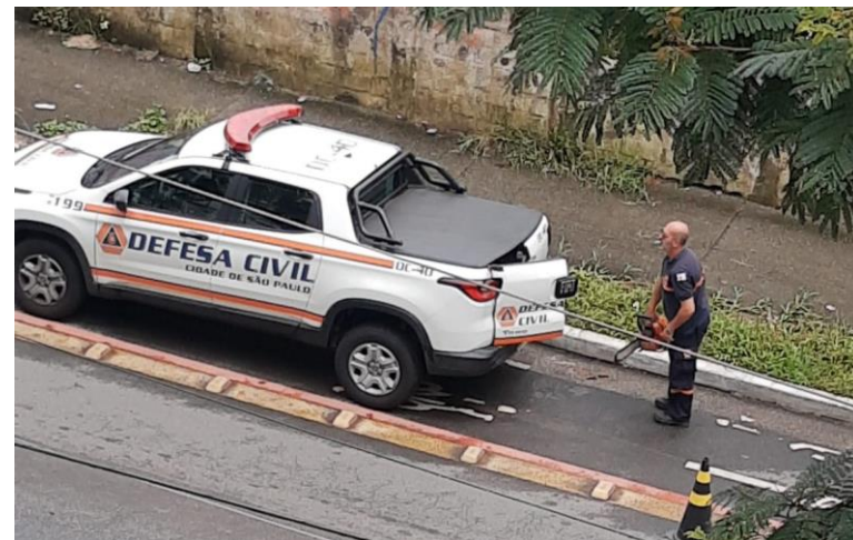
Legenda: Exemplo de ação de defesa civil

A atuação da Defesa civil tem o objetivo de reduzir os riscos de desastres. Também compreendendo ações de prevenção, mitigação, preparação, resposta e recuperação. Sempre que o cidadão sentir-se inseguro em relação a desastres naturais, enchentes, alagamentos, desmoronamentos, escorregamentos de terras, vazamentos de produtos químicos e combustíveis, ou exposto a situações de risco que exijam a atuação de profissionais, podem solicitar os serviços da defesa civil.