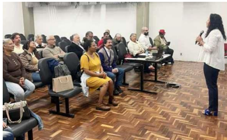
Legenda: Exemplo de Conselho em Funcionamento.

A região não contou com a articulação de outros conselhos e órgãos colegiados. Não desenvolvendo atividades nesse sentido.