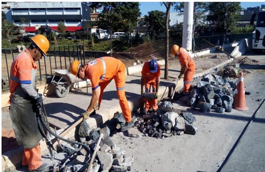
Legenda: Exemplo de Serviço de Manutenção de Logradouros