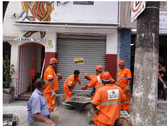
Legenda: Exemplo de fiscalização

Compete às Subprefeituras fiscalizar o cumprimento das normas municipais relacionadas com o código de edificações, zoneamento, abastecimento e posturas municipais. O trabalho consiste em orientar, fiscalizar e prestar informações ao público, sobre irregularidades em obras públicas e particulares. Em 2022, as principais ações fiscalizatórias desenvolvidas foram: Vistorias de comércios, indústrias e estabelecimento que não respeitam a licença de funcionamento, bem como fiscalizar a ocupação e o exercício nos logradouros públicos.