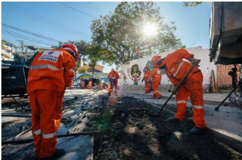
Legenda: Exemplo de Serviço de Tapa Buraco.

O serviço é iniciado com o recorte da área no entorno do buraco, depois é realizada a fresagem do pavimento, ou seja a remoção do asfalto desgastado, em seguida o recorte é preenchido com asfalto novo, de forma nivelada ao pavimento existente.