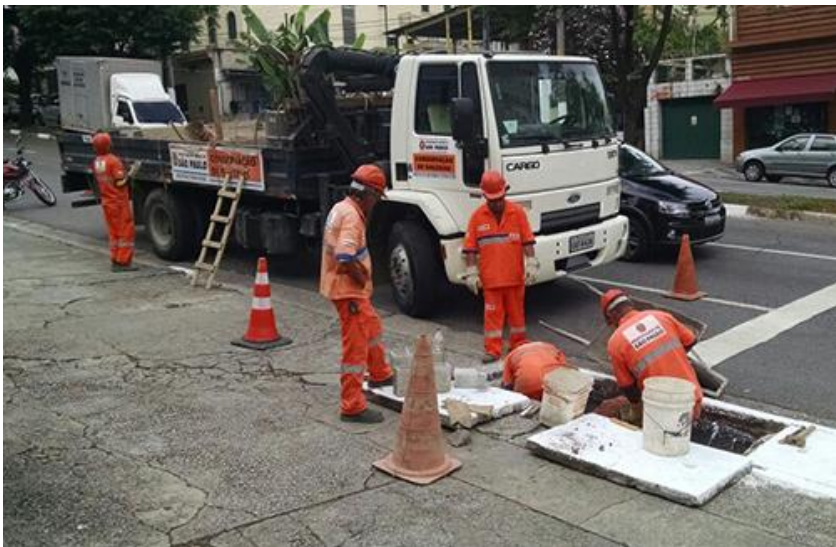
Legenda: Exemplo de Serviço de Drenagem

Atualmente a cidade possui aproximadamente 50 estruturas de contenção que podem ser classificados entre piscinões e polders, construídos em locais estratégicos da cidade, como nas pontes da Marginal Tietê e a locais próximos a rios e córregos, como no curso do rio Aricanduva e do córrego Pirajussara.