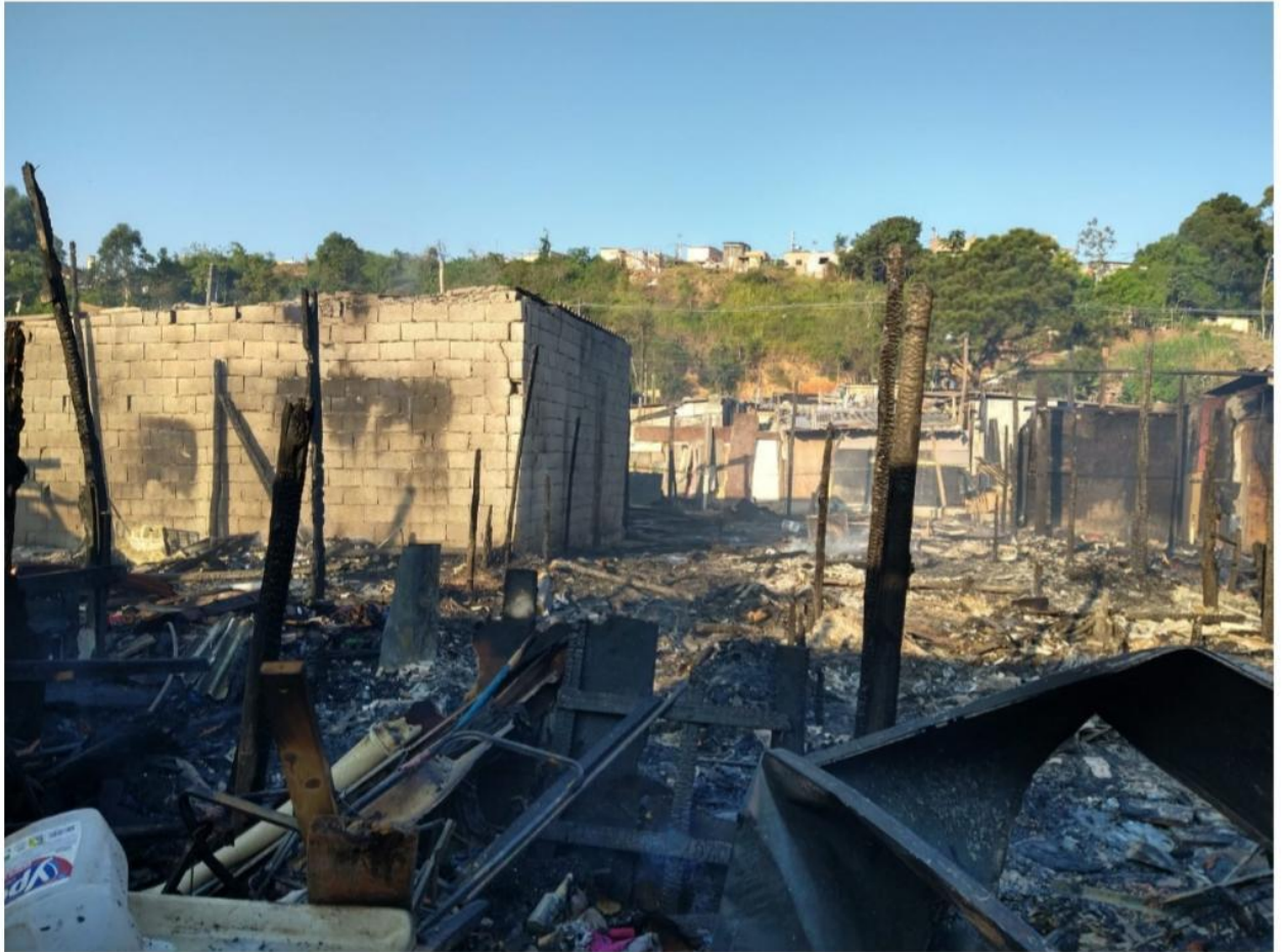
Incêndio na comunidade Souza Ramos