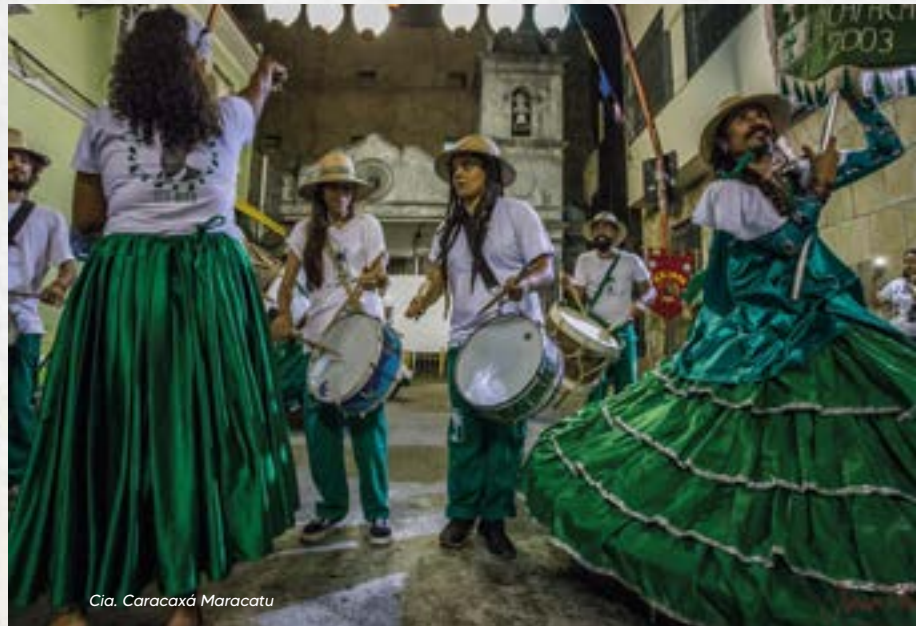
Cia. Caracaxá Maracatu