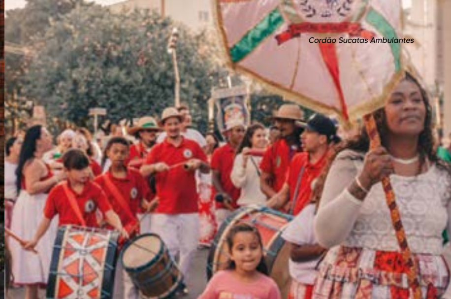
Cordão Sucatas Ambulantes