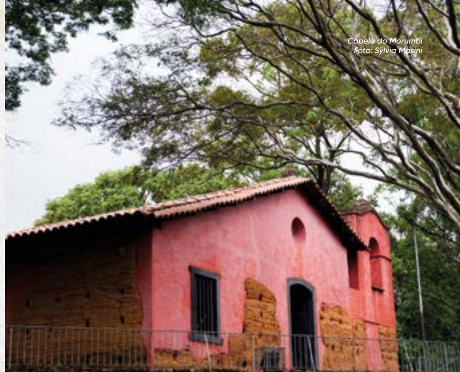
Capela do Morumbi