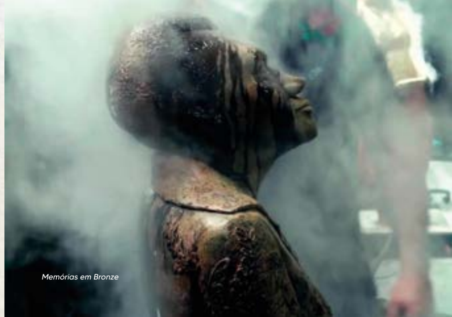
Memórias em Bronze