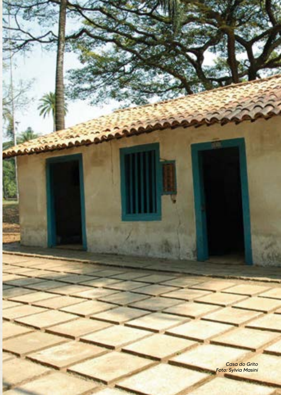
Casa do Grito