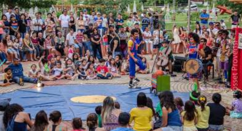
Brinquedos, Brincadeiras e outras Poesias