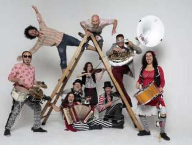
Póin o Pé no Frevo