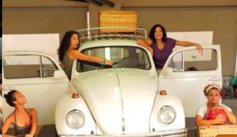
Joaquim, o Fusca que Contava Histórias

Trata-se de um espetáculo itinerante que usa como base de transporte e fonte de histórias um tradicional fusca branco de 1978. A cena começa com o fusca chamado Joaquim chegando de uma de suas longas viagens e