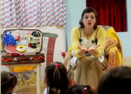
Chá com Machado