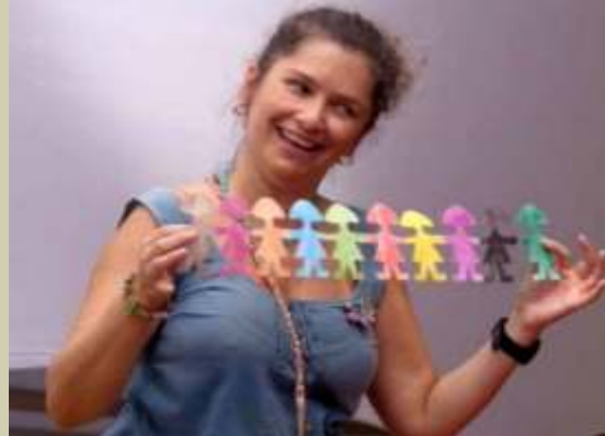
Contos de Ternura, Assombro e Imaginação