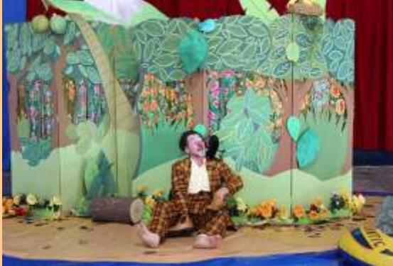
Jacinto tudo numa Ilha