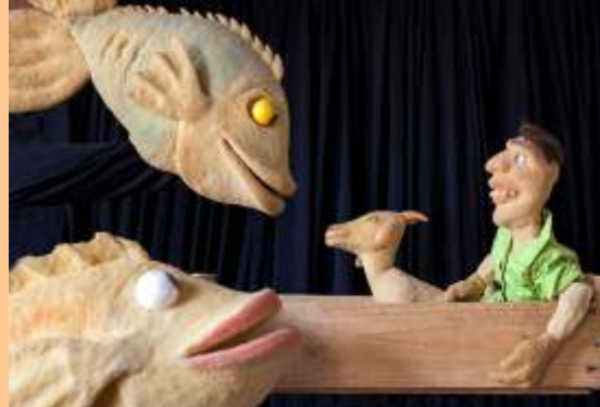
A Saga de João Caixote

O espetáculo narra a história de João, um jovem que sai em busca da Pedra da Lua para curar seu povo que está