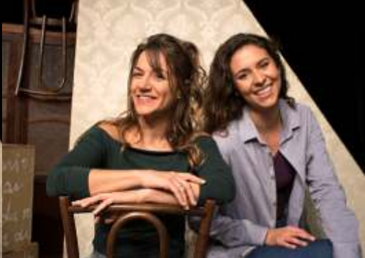
O Livro do Improviso