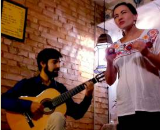
Mulheres de Olhos Grandes