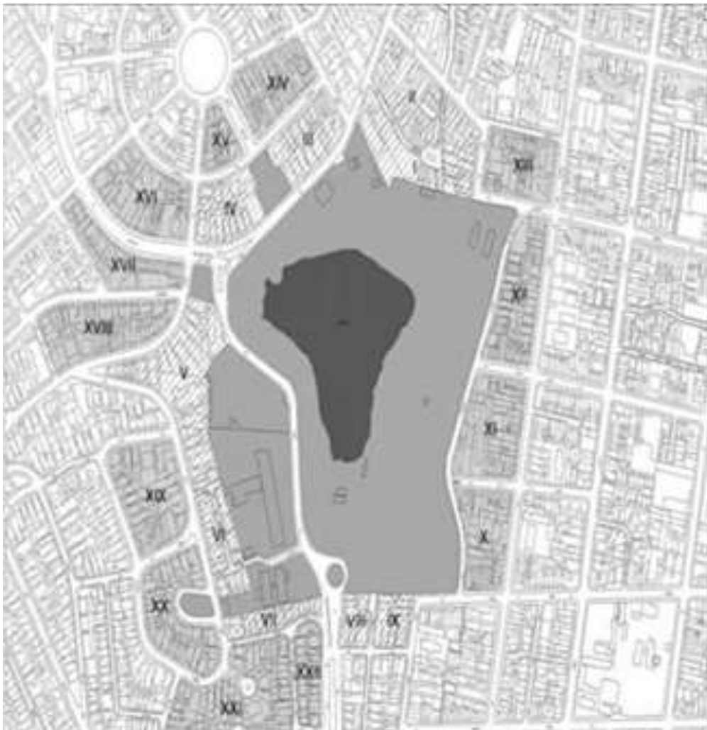
Anexo I – Mapa da área envoltória do Parque da Aclimação e Áreas Verdes Adjacentes