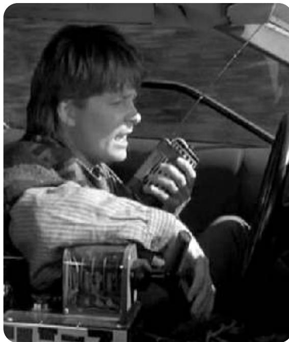
De volta para o futuro III

03, 10, 17 e 24 de novembro; 01, 08 e 15 de dezembro (qua) – 15h – BIJ Monteiro Lobato.