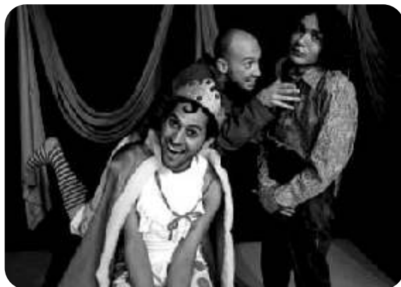
Trupe di Cinco