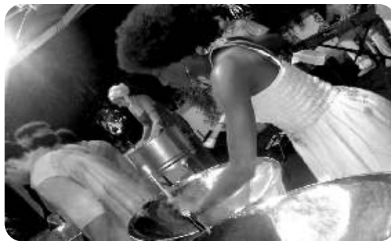
Grupo de Steel Drums Fogo & Steel