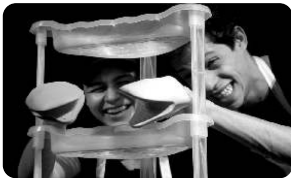
Cia. O Curioso