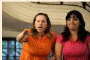
Cla. Toc Toc Posso Entrar?