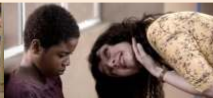
O contador de histórias