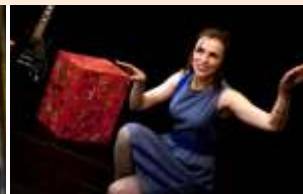
Cia. de Teatro do Studio