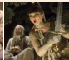
O mundo imaginário do Dr. Parnassus

20 de outubro (dom), 14h – Ônibus-biblioteca Roteiro Vila Silvia.