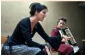
Cia. do Gato