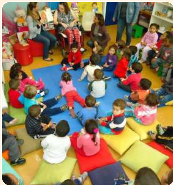
Mediação de Leitura – BP Belmonte