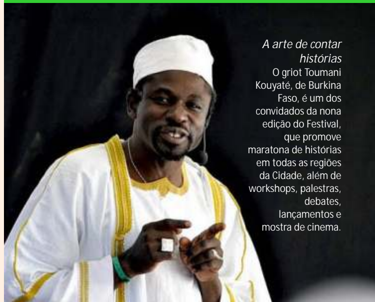
capa: griot Toumani Kouyaté

A arte de contar histórias O griot Toumani Kouyaté, de Burkina Faso, é um dos convidados da nona edição do Festival, que promove maratona de histórias em todas as regiões da Cidade, além de workshops, palestras, debates, lançamentos e mostra de cinema.