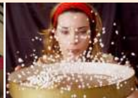
A Hora da História

22 de outubro (ter), 14h30 – BP Hans Christian Andersen 23 de outubro (qua), 14h30 – BP Sérgio Buarque de Holanda 25 de outubro (sex), 14h30 – BP Paulo Duarte 26 de outubro (sáb), 10h – Ponto de Leitura Jardim Lapenna