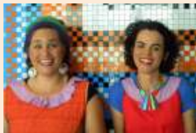
Cia. Ju Cata Histórias