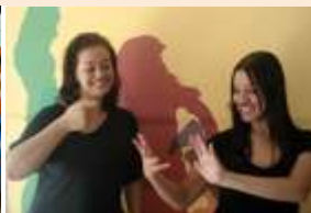
Grupo Mãos de Fada

24 de outubro (qui), 13h – Ônibus-biblioteca Roteiro Jardim Sarah. Z. Leste