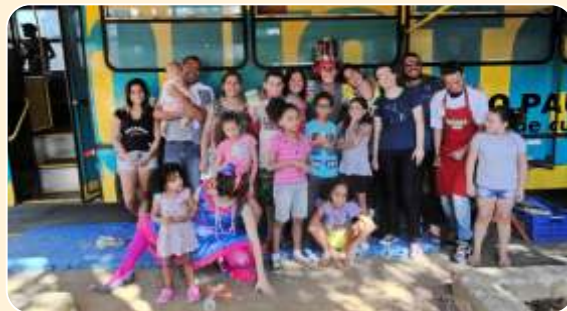
Rolezinho Literário | Grupo Teatro da Mafalda

31 de agosto (dom), 14h – Ônibus-Biblioteca | Roteiro: Parque Residencial dos Lagos