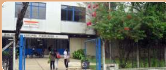
BP Adelpha Figueiredo

Sábados, das 10h às 13h, a partir de 16 de agosto