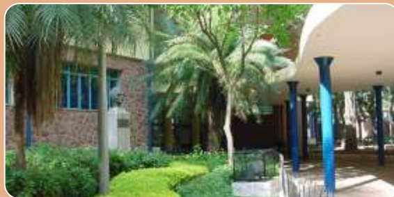
BUI Monteiro Lobato

Agendamento prévio pelo telefone – BUI Monteiro Lobato