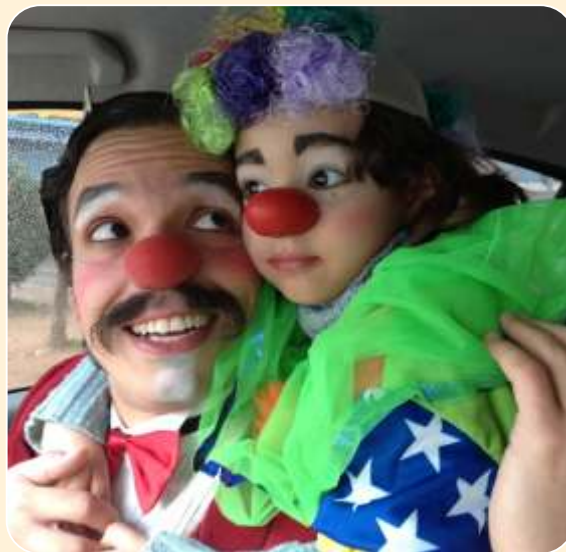
Pelanca e Macarrão | Efeito Dominó