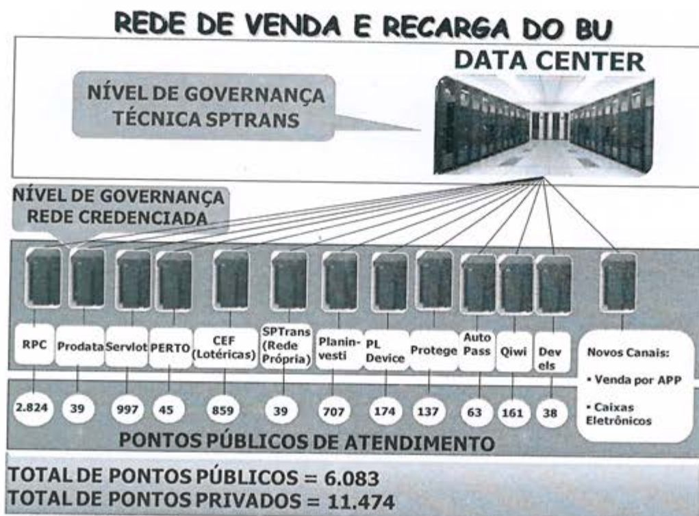
Diagrama 2 : Rede de Venda e Recarga do BU

A rede de venda e recarga on-line possui a arquitetura, ilustrada na figura abaixo: