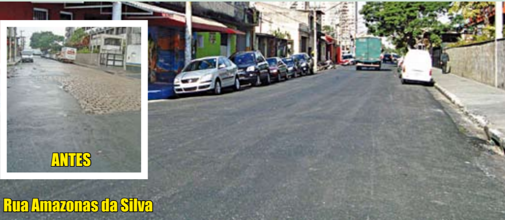
Rua Amazonas da Silva

Com cerca de 2 km, esta via ganhou asfalto novo em toda a sua extensão