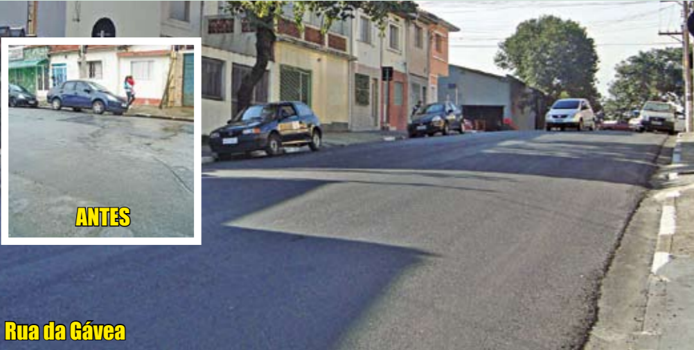
Rua da Gávea

Vias de terra foram pavimentadas e as que estavam com asfalto ruim foram recapeadas pela Prefeitura. Veja abaixo alguns exemplos