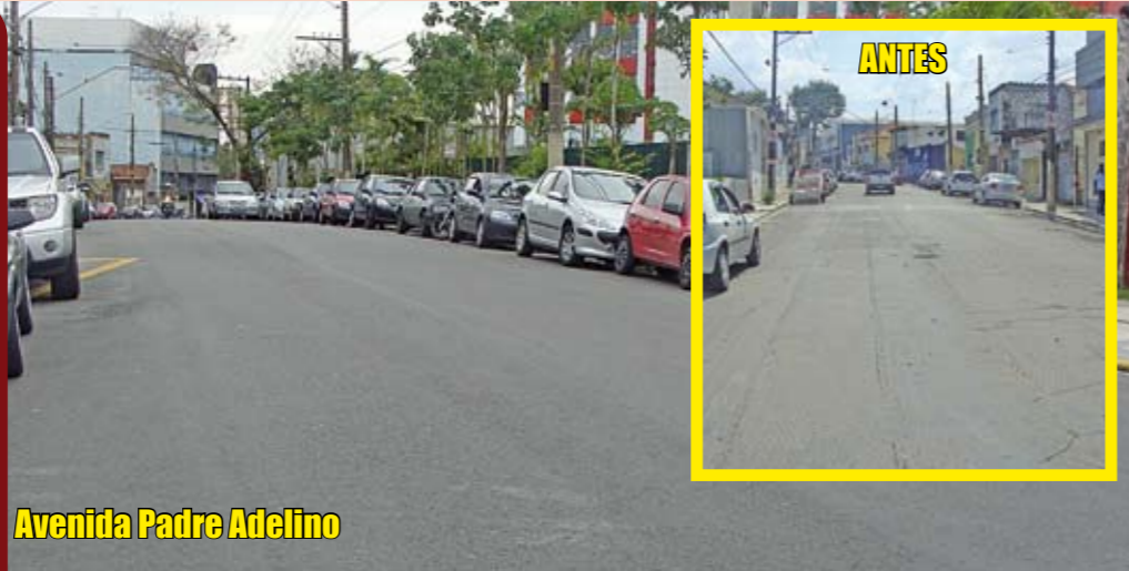
Avenida Padre Adelino

Via de grande circulação de veículos, que liga o Tatuapé ao Belém, esta avenida foi recapeada em março, no trecho que vai da Praça Silvío Romero até rua Barão do Tietê