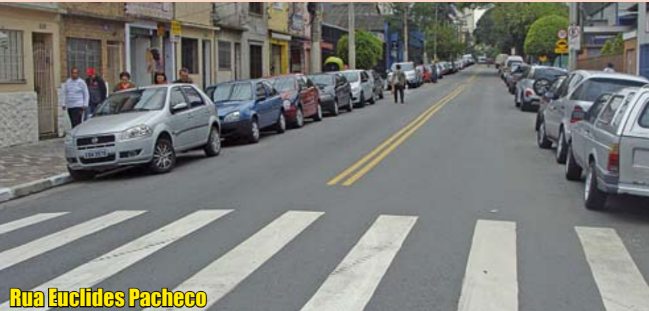
Rua Euclides Pacheco

Depois do recapeamento, que eliminou buracos e rachaduras, esta rua, via comercial do Tatuapé, nem empossou mais água nos dias de chuva