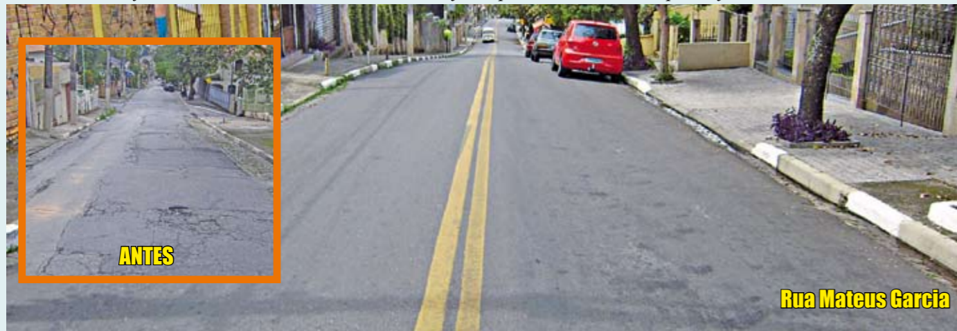
Rua Mateus Garcia

Esta via do Jaçanã, junto com a rua Bassi e a travessa Maria Cassio, foi recapeada no início deste ano pela Prefeitura