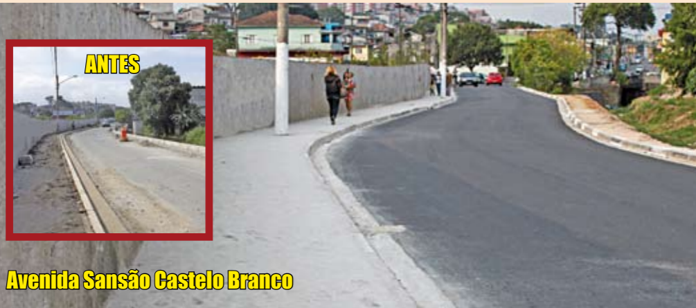
Avenida Sansão Castelo Branco

No Jardim Aurora, distrito de Lajeado, esta avenida ganhou 500 metros de asfalto novo