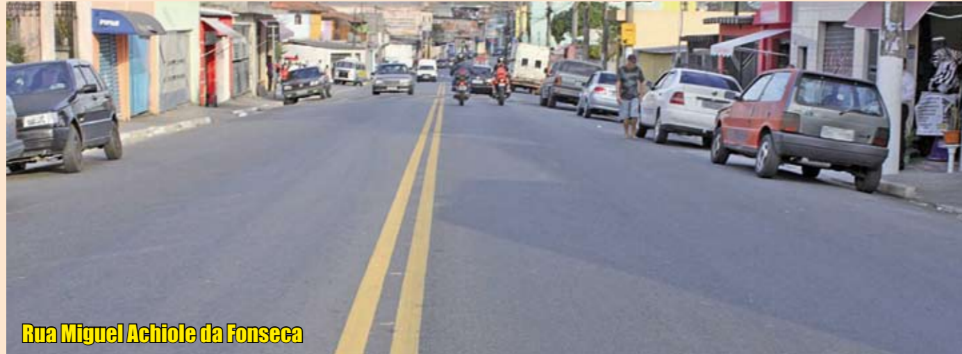
Rua Miguel Achiole da Fonseca

Vias de terra foram pavimentadas e as que estavam com asfalto ruim foram recapeadas pela Prefeitura. Veja abaixo alguns exemplos