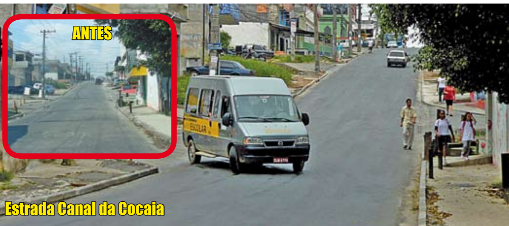
Estrada Canal da Cocaia

A pavimentação no Jardim Itajaí, em 2008, chegou a seis ruas, entre elas a Caméfis