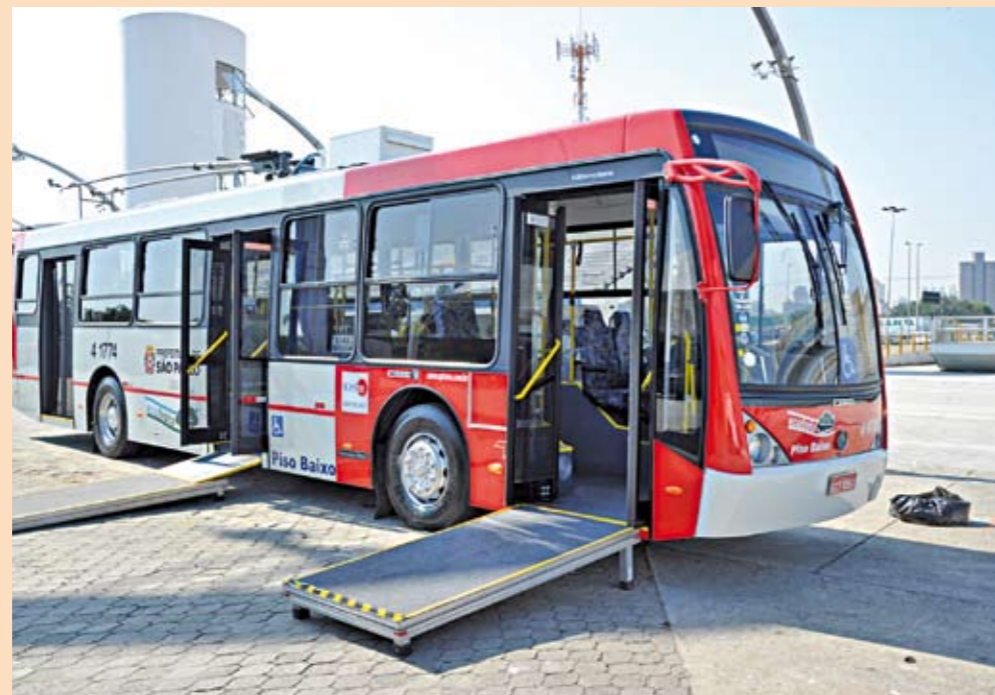
Trólebus novo: capacidade para transportar até 81 passageiros

A Prefeitura já colocou para rodar o novo modelo de trólebus da cidade. E a linha escolhida para receber a novidade é a 2290, que vai do Terminal São Mateus ao Terminal Parque Dom Pedro II. É mais uma etapa do investimento da Prefeitura em coletivos que poluem menos o ar da cidade. A intenção é renovar em 70% a frota de trólebus da cidade até o ano que vem. O novo ônibus tem capacidade para transportar 81 passageiros (sentados e em pé). Tem piso rebaixado e portas mais largas para facilitar o embarque e desembarque. Equipado com tecnologia digital, é mais silencioso e consome menos energia elétrica do que os modelos mais antigos.