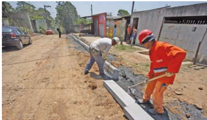
Homens trabalhando: depois das guias, virá o asfalto

Com a chegada da época de chuvas, a Prefeitura dá início à Operação Chuvas de Verão . O Centro de Gerenciamento de Emergências (CGE), órgão responsável pela previsão e monitoramento do tempo na cidade, passa a manter plantões de 24 horas, incluindo finais de semana e feriados, para monitorar a ocorrência e intensidade das chuvas e alertar a população sobre eventuais áreas de risco. No site do CGE ( www.cgesp.org ) é possível acompanhar, em tempo real, informações sobre o tempo, pontos de alagamento e planos de emergência.