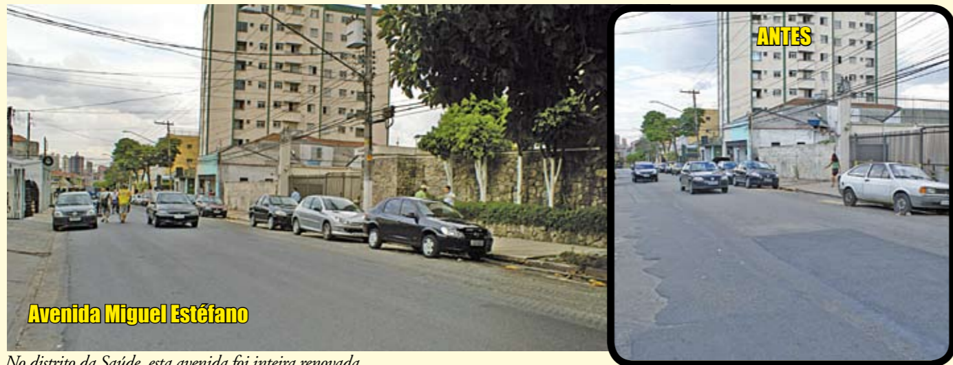
Avenida Miguel Estéfano

Esta avenida, em Moema, teve recapeamento em toda a sua extensão