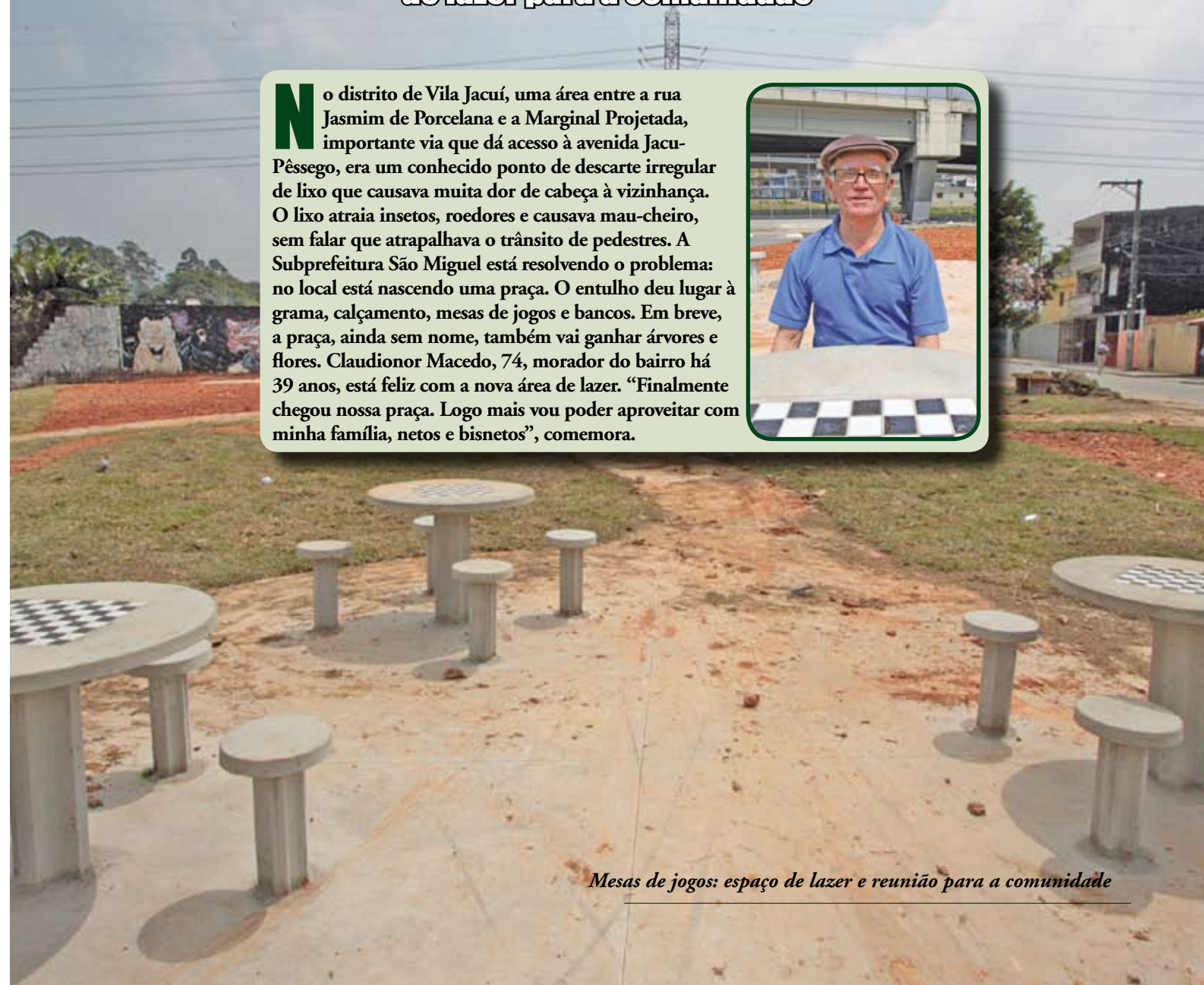
Mesas de jogos: espaço de lazer e reunião para a comunidade