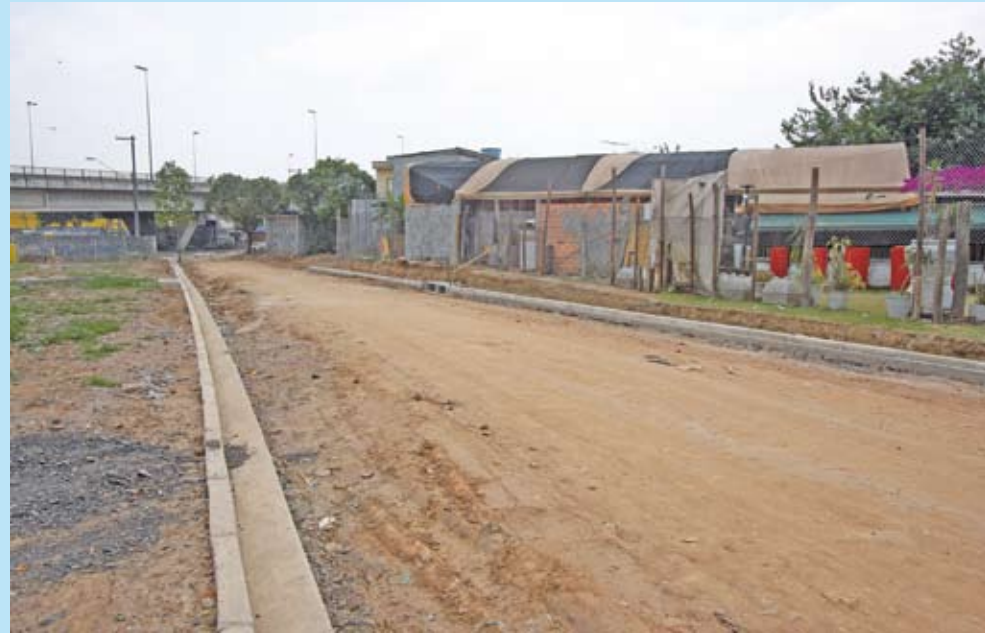
Guias e sarjetas: o próximo passo é a pavimentação da avenida

Com trabalho conjunto entre a Coordenadoria de Projetos e Obras da Subprefeitura São Miguel e a Coordenadoria de Projetos e Desenvolvimento Urbano da Prefeitura, a avenida dos Guris, na Vila Jacuí, está passando por uma obra de expansão. Após a demolição de construções irregulares e a remoção de árvores que obstruíam a via, equipes da Subprefeitura colocaram guias e sarjetas e deixaram o local pronto para receber o asfalto. Para compensar as árvores retiradas, 30 mudas serão plantadas na calçada.