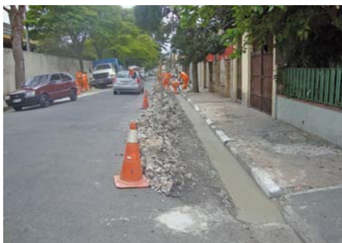
Sarjetas, calçadas e guias: reforma perto do Centro de Santo Amaro

Parte da cabeceira do Aeroporto de Congonhas, uma área municipal na rua Monsenhor Antônio Pepe, no Campo Belo, está sendo cercada com grades. Além de preservar o local, a ação deve evitar que sejam depositados ali restos de comida, que favorecem a proliferação de aves – perigosas para a segurança dos aviões. São 160 metros de gradil de ferro com mureta. Também será instalado portão de ferro com duas folhas. A obra deve ficar pronta este mês.