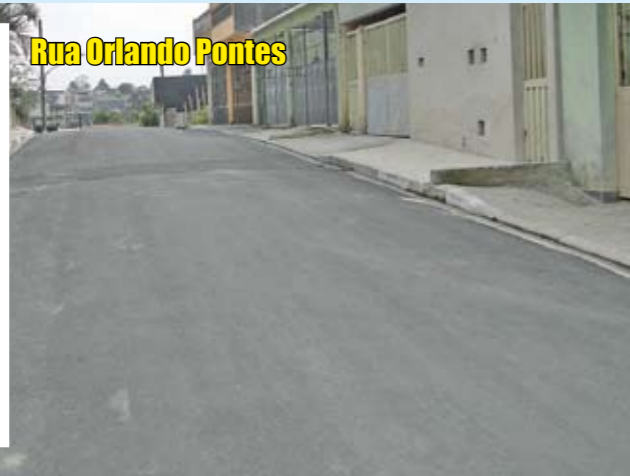
Rua Orlando Pontes