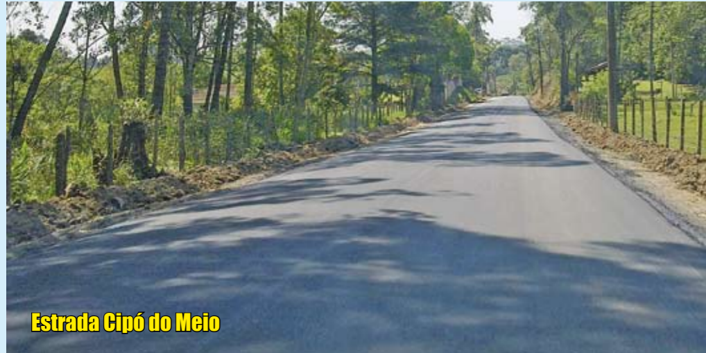
Estrada Cipó do Meio

Vias de terra foram pavimentadas e as que estavam com asfalto ruim foram recapeadas pela Prefeitura. Veja abaixo alguns exemplos