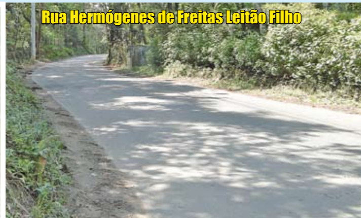
Rua Hermógenes de Freitas Leitão Filho

Sem comércio nem moradores, mas de grande movimento, esta rua é mais conhecida como Estrada do Itaim