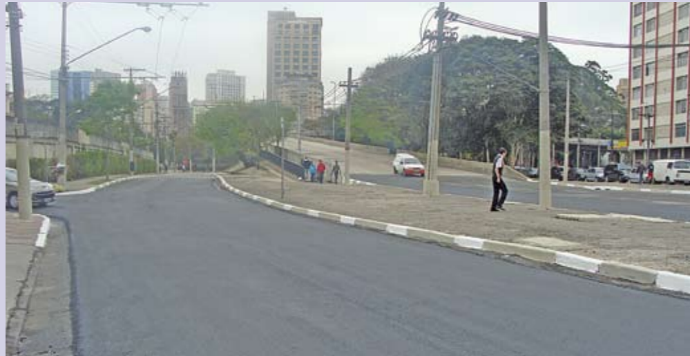
Rangel Pestana: 1,5 km de pavimento recapeado

Importante via de ligação entre o Centro e a zona Leste da Cidade, a avenida Rangel Pestana está passando por obras de recapeamento. O trecho contemplado inicialmente vai do Viaduto 25 de Março à rua José de Alencar, que corta a região da Subprefeitura Mooca, cerca de 1,5 km. A pavimentação será refeita em todas as faixas de rolamento.