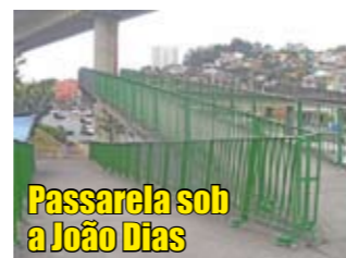
Passarela sob a João Dias

Já estão em uso os gradis de segurança na passarela sob a av. João Dias. A grade havia sido danificada pelo desgaste natural e pelo mau uso. Desta vez, entretanto, todo o equipamento ganhou tratamento anticorrosivo para garantir maior vida útil. As bases de sustentação também foram reforçadas. O local é importante ponto de acesso aos usuários do Terminal João Dias e da estação de Metrô Giovanni Gronchi.