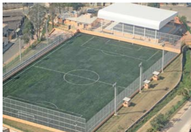
Jardim Ângela: campo de grama sintética, com iluminação