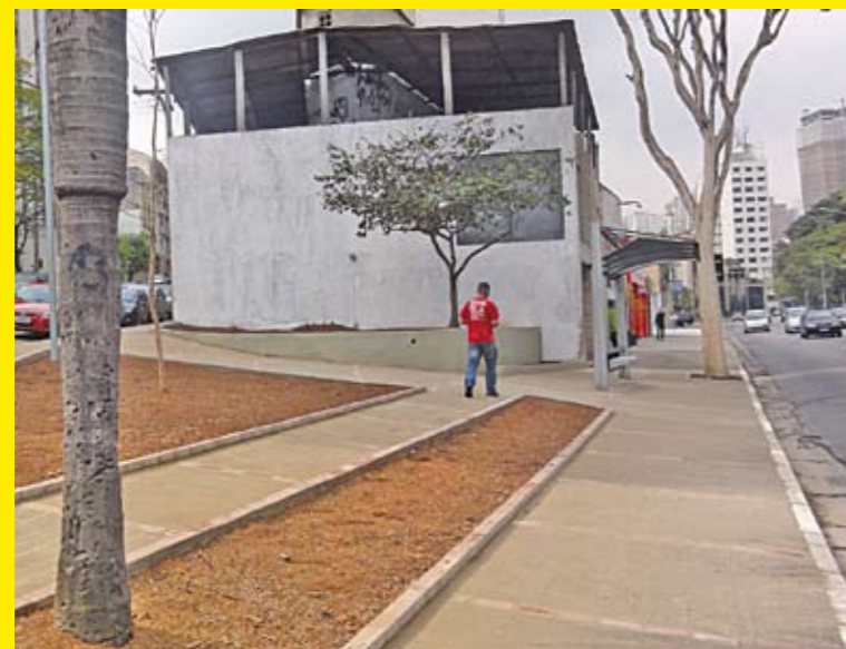
Avenida Sumaré com a rua Homem de Mello: para evitar descarte

A Subprefeitura Lapa está intensificando o combate aos pontos viciados de descarte de entulho da região. Para isso, está adotando medidas que vão desde a colocação de alambrados e construção de floreiras até o levantamento do piso para impedir a entrada de caminhões que jogam o entulho. Oito pontos já estão em obras. Dois ficam no distrito da Lapa, três no Jaguaré, um em Perdizes, um na Vila Leopoldina e um no Jaguará. Veja ao lado.