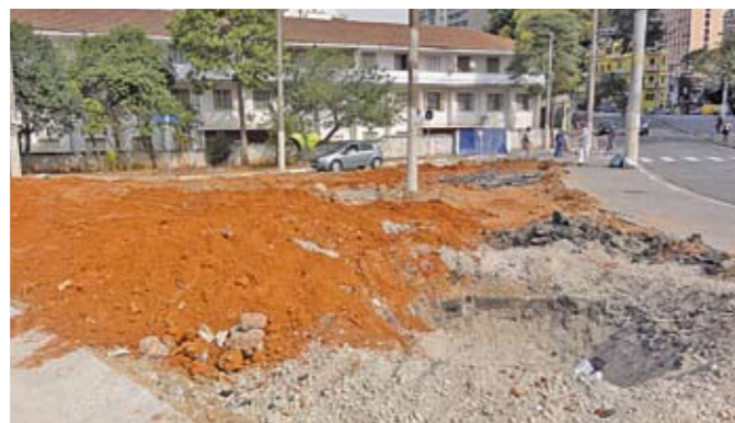
Canteiro central entre as ruas Tagipuru e Adolfo Pinto: em obras

O Clube Escola Lapa ganhou cinco aparelhos de ginástica para a terceira idade. A prática de exercícios nesses equipamentos melhora a coordenação motora, equilíbrio, força, respiração e ainda fortalece as pernas. Isso tudo resulta em melhor mobilidade e disposição para as atividades diárias. A instalação dos aparelhos faz parte de um projeto da Secretaria Municipal de Esportes, Lazer e Recreação, que vai colocar equipamentos desse tipo em todos os clubes escola da cidade. O Clube Escola Lapa fica na rua Belmont, 957, no distrito da Lapa. O telefone de lá é 3834-0032.