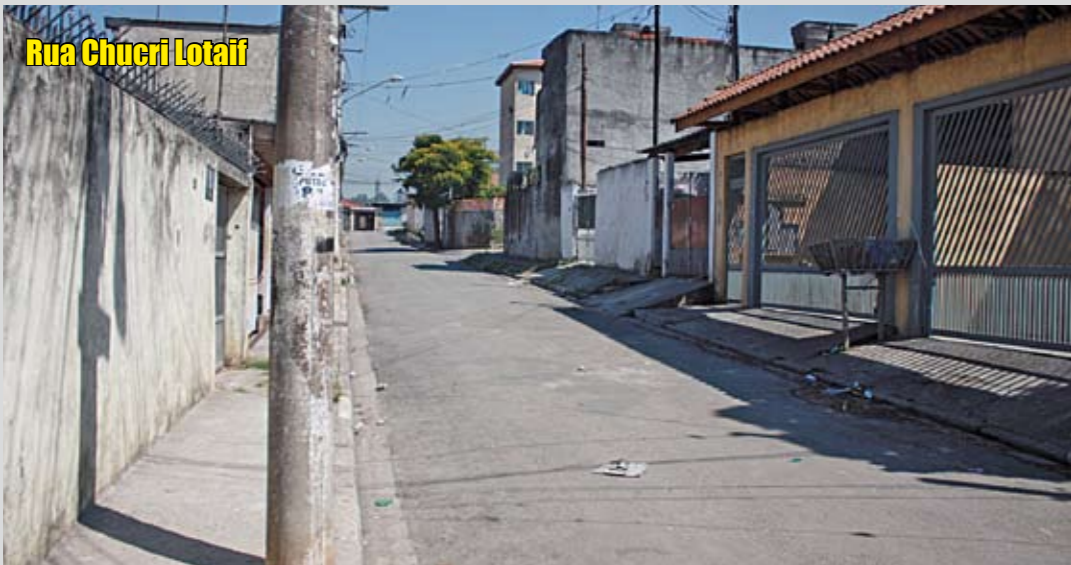
Rua Chucri Lotaif

Vias de terra foram pavimentadas e as que estavam com asfalto ruim foram recapeadas pela Prefeitura. Veja abaixo alguns exemplos