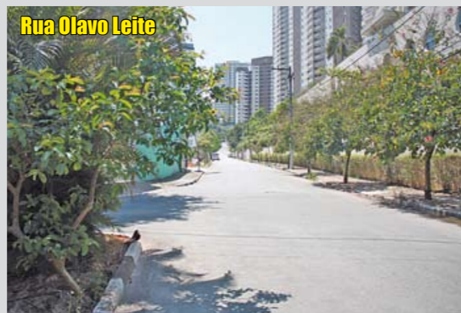
Rua Olavo Leite

Na Vila América, 450 metros de asfalto novo