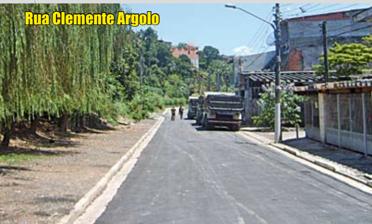
Rua Clemente Argolo

Esta rua residencial, no Jardim Germânia, ganhou 110 metros de asfalto