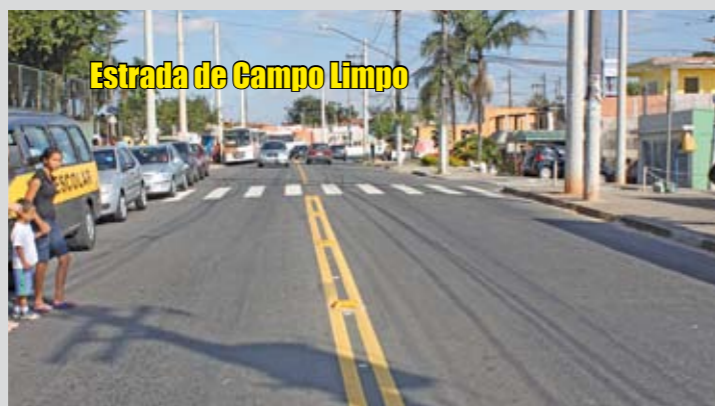
Estrada de Campo Limpo

A grande via de acesso ao bairro ficou como um tapete