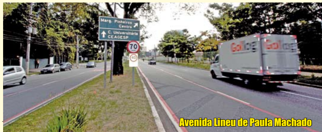
Avenida Lineu de Paula Machado