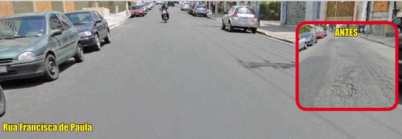
Rua Francisca de Paula

O asfalto rachado desta via, no distrito de Vila Carrão, foi substituído por outro novinho no primeiro semestre do ano passado