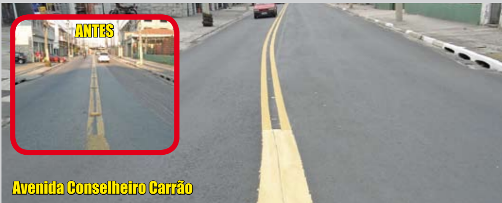
Avenida Conselheiro Carrão

A pavimentação desta rua foi renovada no trecho que vai da rua Antonio Peres Mulla até a avenida 19 de Janeiro