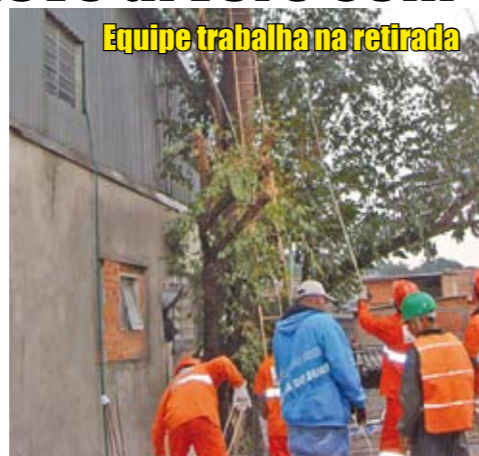
Equipe trabalha na retirada

O que parecia uma tarefa simples acabou dando um trabalho. Levou sete dias e envolveu uma equipe de 20 funcionários da Subprefeitura a remoção de uma árvore que oferecia risco de cair sobre as casas da rua Domingos Sérgio dos Anjos, próximo da rua Jonas Eudoque dos Santos, no distrito de São Domingos. Por se tratar de uma árvore grande e por estar em um local de difícil acesso, foi preciso contar com o apoio da Defesa Civil e da Guarda Civil Metropolitana (GCM). Caso você perceba alguma árvore que apresente risco de queda em uma rua, informe a Subprefeitura da região.