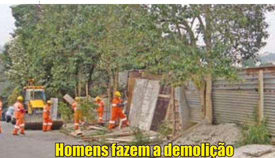
Homens fazem a demolição

No fim de agosto, uma equipe especializada da Subprefeitura demoliu uma casa construída em área municipal na rua Ema Albani, Cidade d'Abril – Gleba 1, no distrito do Jaraguá. Este loteamento foi instalado em área pública e vendido como se ocupasse área privada. O dono dessa casa e também os de outras construções feitas ali foram notificados várias vezes da situação irregular e não tomaram providências. Por isso, o trabalho de remoção deve continuar.