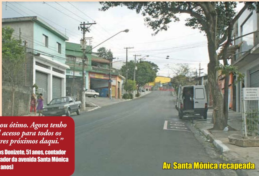
Av. Santa Mônica recapeada

M ais uma via da nossa região ganhou camada nova de asfalto. Foi a avenida Santa Mônica, no trecho entre as ruas Ribeirão Vermelho e Desembargador Joaquim Bandeira de Mello, em um total de 1,2 quilômetro. A obra foi feita pela Secretaria de Coordenação das Subprefeituras e melhorou muito a vida da população que circula por ali.