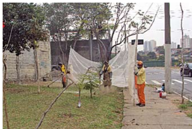
Limpeza: equipe faz o corte do mato no canteiro

Sabe aquele sofá velho, armário estragado ou cadeira quebrada? Não jogue na rua. Espere o caminhão do Cata-Bagulho passar; ele recolhe. E leva também eletrodomésticos sem uso, restos de madeira e pneus, entre outros objetos sem utilidade. Só não vale lixo doméstico, entulho de obras, material de jardinagem e poda, lixo hospitalar e industrial. Para saber quando o Cata-Bagulho estará em seu bairro, ligue para a Praça de Atendimento da Subprefeitura Penha: 3397-5100.