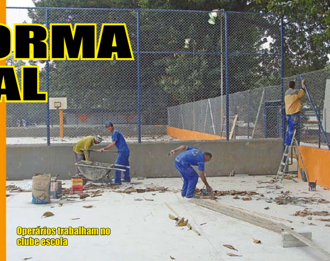
Operários trabalham no clube escola

Agora falta pouco. Entrou na reta final a ampla reforma do Clube Escola Mooca, que começou em junho. Estão passando por reparos as cinco quadras (uma de tênis, uma de futebol de salão e três poliesportivas), o que inclui revisão das instalações elétricas e iluminação, construção de canaletas de concreto para o escoamento das águas pluviais, revestimento e pintura das muretas, substituição dos alambrados, novos portões de acesso e a instalação de novas tabelas de basquete. O ginásio poliesportivo será inteiramente remodelado, com pintura interna e externa e demarcação das quadras, entre outras melhorias. A reforma engloba também seus vestiários, com a troca das torneiras, chuveiros, revestimentos cerâmicos e pisos. As piscinas recreativas não ficaram de fora. Nelas serão reparadas as muretas e a iluminação. Novos portões serão instalados. Os seus vestiários também ganham piso novo, além da revisão das instalações hidráulicas.