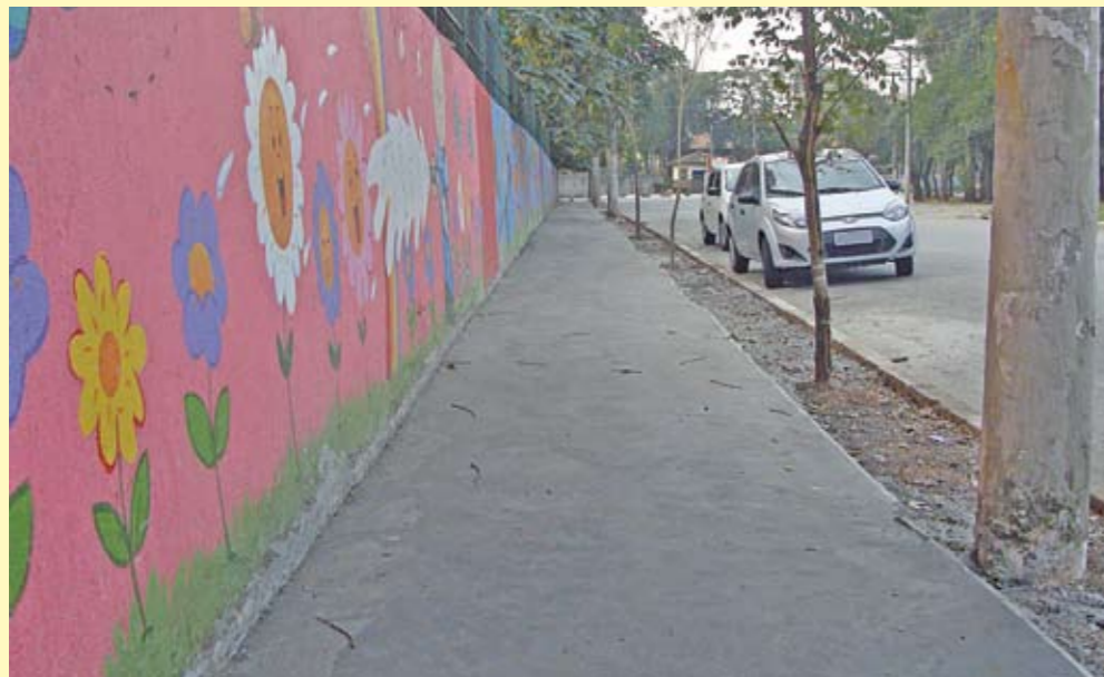
Calçada da EMEI Prof. Eloy Poli Bifone: reforma do passeio

locomoção de pessoas com deficiência visual, e plantar grama em uma faixa da calçada. Em seguida, o programa chega à praça Ilo Ottani, no Pari. Além da reforma do passeio público, instalação de rampas de acesso para portadores de mobilidade reduzida e reparo de guias danificadas, a área verde da praça também passará por manutenção.