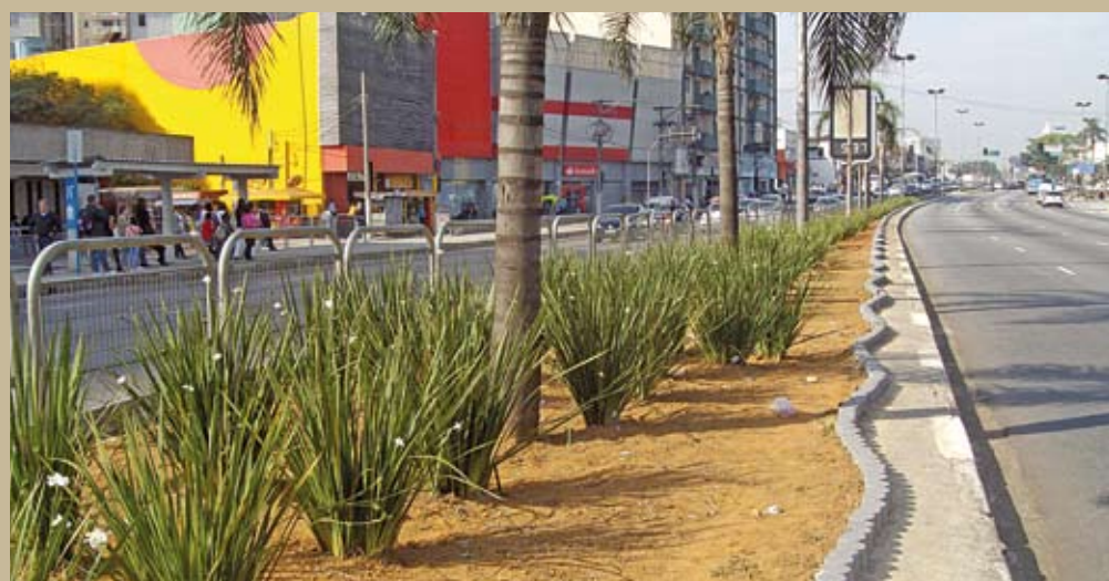
Avenida Engenheiro Armando de Arruda Pereira: mudas novas de plantas para todo lado.