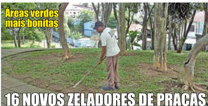
Áreas verdes mais bonitas