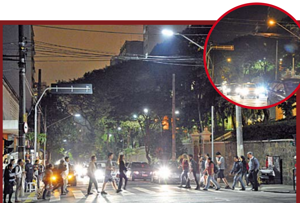
Rua Maria Antonia com nova iluminação; no detalhe, como era antes