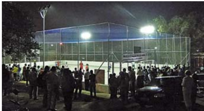
Quadra na Casa de Cultura Cora Coralina: equipamento novo

Protocolo de cooperação foi assinado pela Prefeitura e pela Associação dos Familiares e Amigos das Vítimas do Vôo TAM JJ3054 (Afavitam) para construir uma praça na área em que caiu o avião da TAM (foto), diante do aeroporto de Congonhas, em 2007. O espaço vai se chamar Praça Memorial 17 de Julho, o dia do acidente.