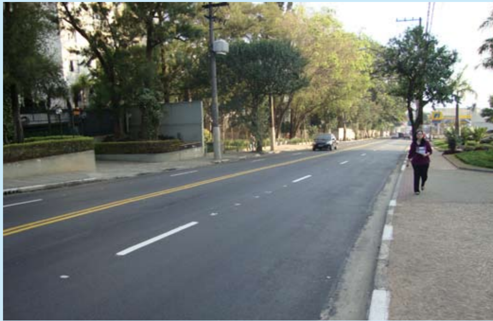
Av. Washington Luís: agora, toda renovada

Quem passa pela av. Washington Luís vai notar: em todos os 3 km da av. Interlagos à praça Dom Francisco de Souza a pista está nova, recapeada, e a sinalização, toda pintada. Ficou mais fácil andar ali, de carro, de ônibus ou a pé. Este ano, nossa região teve 15 ruas renovadas com 224.000 m 2 de asfalto. No ano passado, também foram recapeadas outras 15 ruas, com 265.000 m 2 . Em toda a cidade, com a nova etapa de recapeamento, já foram cobertos 1.933 km de vias desde 2005.