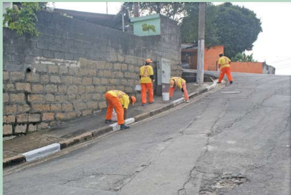
Funcionários trabalham na rua Doutor Osvaldo Urioste, na Vila Pereira Barreto, em Pirituba

Várias ruas e avenidas passaram por serviços de conservação de guias e sarjetas na região, na última semana de julho. A Subprefeitura Pirituba/Jaraguá, por meio da Coordenadoria de Infraestrutura e Manutenção Urbana (CMIU), colocou nas ruas equipe com dez funcionários para pintar as guias e sarjetas de vias de movimento constante. O serviço foi feito nas avenidas Benedito de Andrade, Cabo Adão Pereira e General Edgar Facó, e nas ruas Paulo Barreto, Salvador Sala, Luiz Braile, Doutor Osvaldo Urioste e Luis Carneiro, entre outras. A Subprefeitura realiza rotineiramente esse tipo de serviço, investindo na melhoria constante da nossa região.