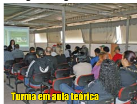
Turma em aula teórica

Mais uma turma do curso para o Programa Zeladoria de Praças se formou em Pirituba. Durante quase um mês, 22 alunos frequentaram aulas teóricas e práticas para aprender a cuidar das praças e áreas verdes da nossa região. Em geral, são trabalhadores desempregados e moradores do entorno das praças selecionadas pelo programa - uma parceria entre as secretarias municipais de Desenvolvimento Econômico e do Trabalho, do Verde e do Meio Ambiente, e de Coordenação das Subprefeituras. Esses novos profissionais estão prontos para deixar nossas praças mais limpas e bonitas.