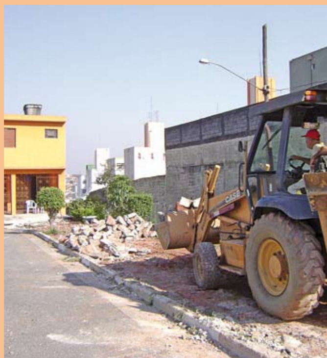
Cohab José Anchieta: valorização de imóveis