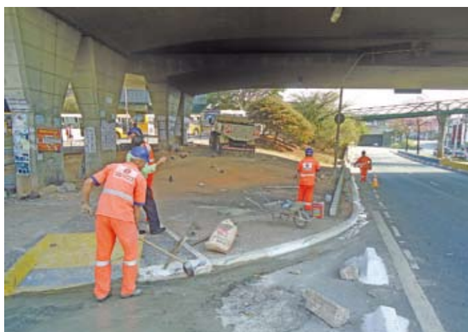
Baixos do viaduto: espaço vai ganhar jardim

A área sob o viaduto Milton Leão, anexa à estação do metrô Artur Alvim, próximo à avenida Águia de Haia, tirava o sossego da população. Sem iluminação, era ponto de descarte irregular de lixo e esconderijo de usuários de drogas. As pessoas pediram e a Subprefeitura Penha começou os trabalhos de reforma. Postes de luz estão sendo instalados, as sarjetas estão sendo limpas e um pequeno jardim será feito.