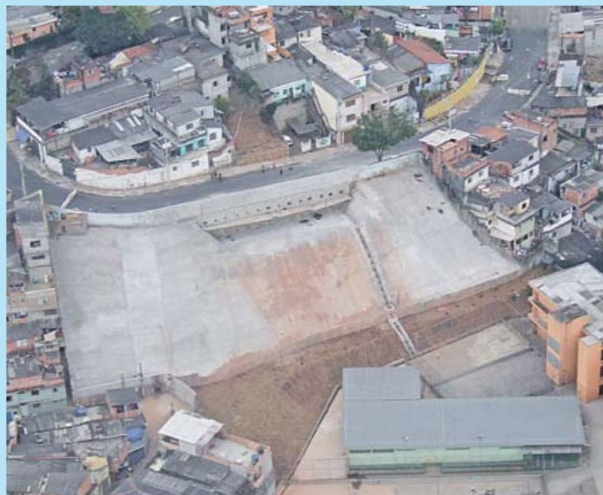
A EMEF Mário Moura Albuquerque: talude para contenção da encosta

Aquela encosta assustava quem estuda ou trabalha na escola, e mesmo quem mora perto da EMEF Mário Moura Albuquerque, na rua Humberto de Almeida, Chácara Santana, distrito de Jardim São Luís. No início do ano, houve um escorregamento de terra, depois de forte chuva. Antes que houvesse contratempos maiores, a Prefeitura começou a reconstruir um muro e a fazer obra para conter a encosta, no lado da rua Manuel Vieira Sarmiento. Agora, a obra está pronta. São 1.750 m 2 de talude de concreto, que impedem a encosta de desabar com a chuva. A contenção tem 28 metros de comprimento por 5 metros de altura (140 m 2 ), mais os 1.610 m 2 de base do talude, protegido por solo grampeado – concreto projetado para dentro da terra. Também foi reconstruído o muro da escola e recuperadas pavimentação e drenagem da rua de cima, a Manuel Vieira Sarmiento. Ficou mais seguro.