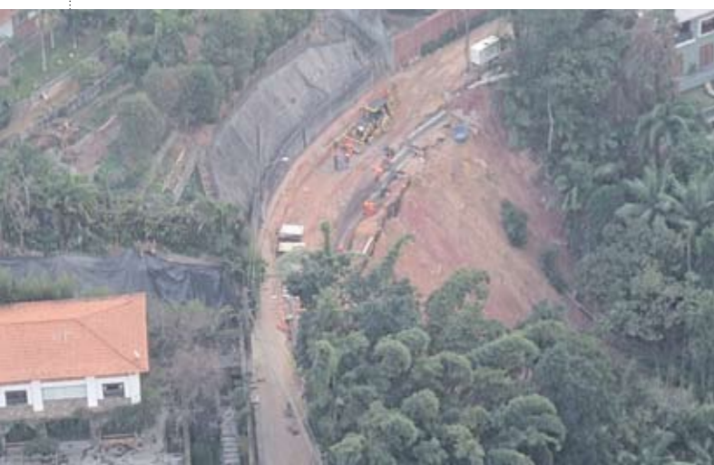
Em obras: muro de arrimo em concreto no Jardim Lido

São cerca de 400 m 2 de talude, ao longo de 30 metros de encosta. É um muro de arrimo em concreto armado, que vai proteger a rua Fan, no Jardim Lido, distrito do Jardim São Luís. Encostado na represa, o local foi comprometido por escorregamento do talude que ali existia depois de chuvas fortes. Com o novo muro, apoiado em estacas cravadas a até 8 metros de profundidade, também será feito novo piso. A obra fica pronta até o final do ano.