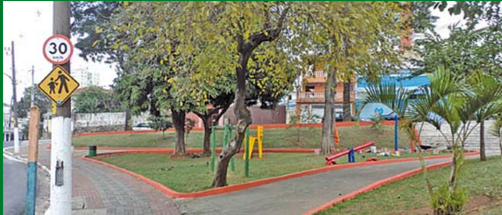
Praça Barão de Japurá: ponto de lazer na Vila Guarani, agora, com rampas de acesso

E stá como nova a praça Barão de Japurá, na Vila Guarani: foram pintadas guias, muretas e brinquedos. Agora, também há rampas de acesso para portadores de necessidades especiais. A Barão de Japurá é, ainda, uma das 42 do Jabaquara que são atendidas pelo programa Zeladores de Praças: pessoas