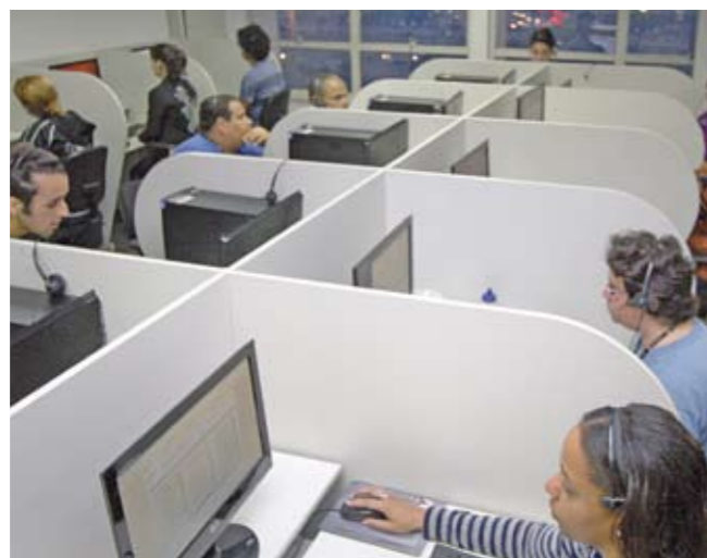
Central de atendimento: 18 ligações ao mesmo tempo

Anote aí: o telefone para contato com o serviço Ligue Luz mudou. Agora, você deve ligar para o 0800-7790156 para informar problemas com a iluminação pública. O nome do serviço também foi trocado, para Ligue Ilume. As mudanças não param por aí. O atendimento passou a ser feito por uma empresa especializada em teleatendimento e ficará instalado no próprio Departamento de Iluminação Pública (Ilume), órgão da Secretaria de Serviços. Com a nova estrutura, será possível atender 18 ligações ao mesmo tempo, diminuindo o tempo de espera.