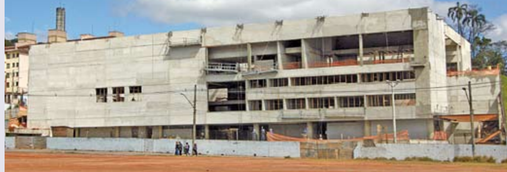
Centro de Formação Cultural: obras já entraram na fase do acabamento

Falta pouco para terminar uma das mais importantes obras na área da cultura que a Prefeitura está fazendo em nossa região. Mais alguns meses e fica pronto o Centro de Formação Cultural Cidade Tiradentes, localizado em um terreno com mais de 23 mil m 2 no encontro das avenidas Alexandre Davidenko e Inácio Monteiro. O esqueleto do prédio, de