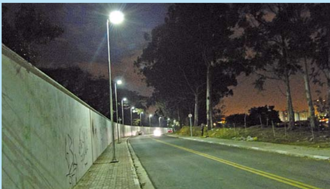
Novas lâmpadas: luz branca e brilhante melhora a segurança para quem passa pelo local à noite

C ircular à noite pela avenida Flor de Vila Formosa e em sua continuação, a rua Gaspar Viana, na Vila Formosa, ficou mais seguro. Um acordo entre a Prefeitura e a AES Eletropaulo melhorou a iluminação das vias. Foram instaladas só na Gaspar Viana 30 postes com lâmpadas de vapor metálico, que produzem uma luz muito branca e brilhante, melhorando a iluminação do local.