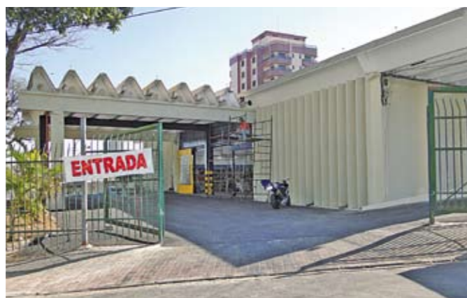
Mercado Municipal: recapeamento do asfalto e pintura