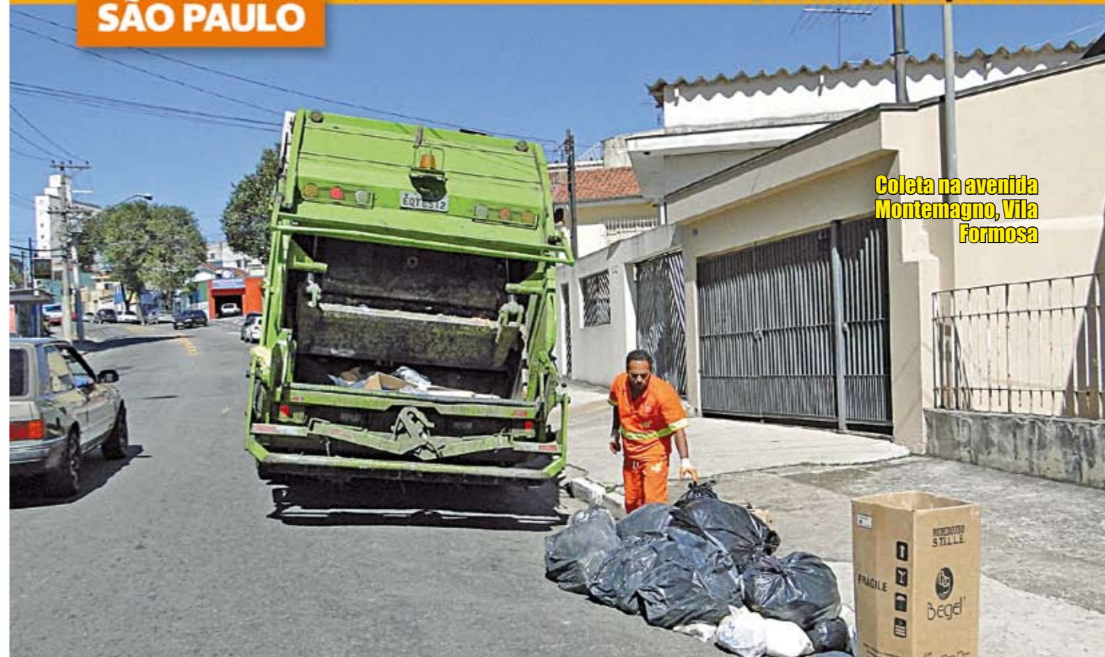
Coleta na avenida Montemagno, Vila Formosa