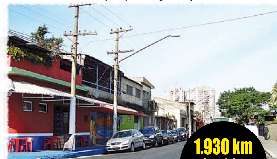
Rua Amazonas da Silva, antes e depois: asfalto novo agora, um tapete

1.930 km de asfalto novo em toda a cidade desde 2005