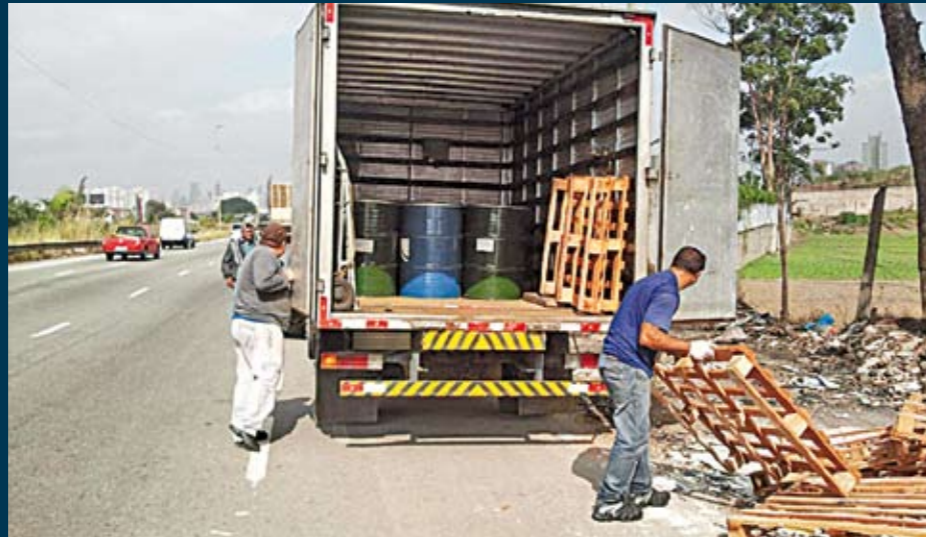
Flagrante: em plena luz do dia, descarte de material irregular

E m junho, um caminhão foi flagrado descartando entulho na avenida Educador Paulo Freire, uma das vias mais movimentadas e importantes do Parque Novo Mundo, distrito de Vila Maria. O motorista foi multado em R$ 12 mil e o veículo, apreendido. Despejar entulho em vias públicas é crime ambiental. Os ecopontos recebem pequenos volumes de entulho (até 1 m 3 por dia), objetos como móveis, poda de árvores e resíduos recicláveis. Em nossa região, temos o Ecoponto Vila Guilherme, na rua José Bernardo Pinto, 1480 (ao lado do Clube da Coroa).