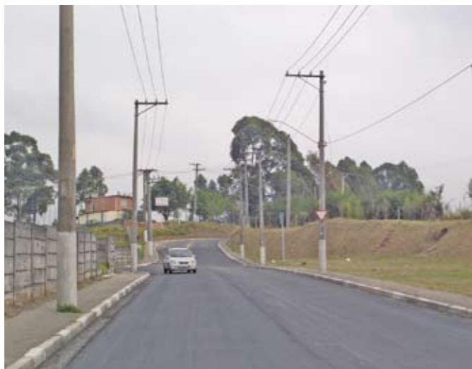
Trecho da rua Mogeiro que ganhou nova camada de asfalto

A Prefeitura está tornando mais confortável e segura a caminhada de pedestres pelas calçadas no entorno de escolas públicas da região. O passeio da EMEF Profª. Philó Gonçalves dos Santos, em Perus, por exemplo, foi refeito. O da EMEF Cândido Portinari, no mesmo distrito, está em obras e deve ter uma parte com paisagismo, tornando-se a chamada "calçada verde". E outras mais vêm por aí.