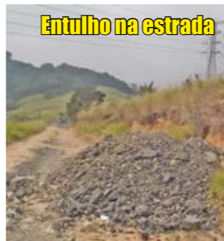
Entulho na estrada

Onze montes de raspa asfáltica deixados irregularmente ao longo da estrada da Cascata, próximo do km 21 da rodovia Anhanguera, sentido capital-interior, foram apreendidos por fiscais da Subprefeitura Perus, em conjunto com a GCM Ambiental. O local é Zona de Proteção Ambiental (Zepam), sob atuação da Operação Defesa das Águas. Também foram recolhidos ali materiais de construção largados perto de uma construção irregular de imóvel. O responsável pela construção foi multado e o material foi levado para o depósito da Subprefeitura Perus.