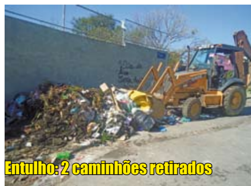
Entulho: 2 caminhões retirados

telecentros, sendo um da rede estadual Acesso São Paulo. Em todas as unidades as atividades são gratuitas. No novo endereço, os usuários pode fazer cursos de digitação, produção de planilhas e criação de páginas na internet. E o melhor de tudo: dá para sair do curso com um certificado e melhor preparado para o mercado de trabalho.