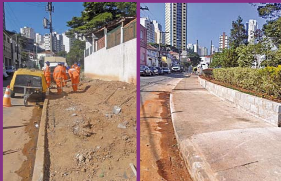
Trechos da calçada da rua Francisco Bayardo: um em obras, outro pronto

As obras da calçada da rua Francisco Bayardo, no distrito de Perdizes, foram retomadas. Elas estavam paradas, aguardando apoio da Eletropaulo para a retirada de uma árvore. A reforma vai renovar o passeio de toda a extensão da rua, inclusive com a troca de guias e sarjetas danificadas e a instalação de floreiras em locais que antes funcionavam como pontos de descarte de entulho e também como estacionamento irregular. A medida é uma das ações da Subprefeitura Lapa na retomada de áreas públicas invadidas. As obras de um trecho do passeio já foram concluídas.