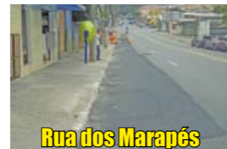
Rua dos Marapés

Veículos pesados, em especial ônibus, eram o terror de quem morava na rua dos Marapés. Explica-se: os veículos faziam o piso ficar irregular. Perto da parada de ônibus foi pior: o asfalto cedeu. Para atender os moradores, uma equipe de manutenção recompôs a pavimentação em frente à parada. O novo piso suporta veículos mais pesados.