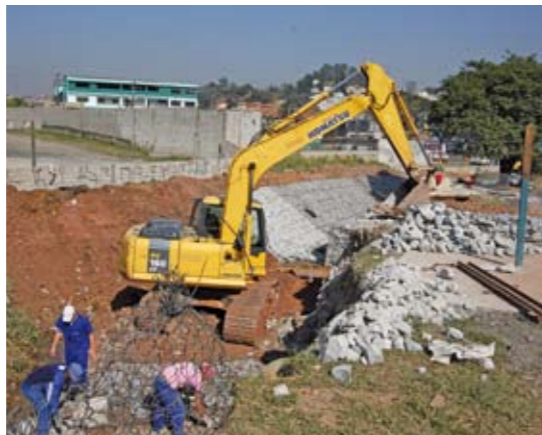
Córrego Guaiaúna: gabião e limpeza do leito

Em parceria com a Sabesp, através do Programa Córrego Limpo, um afluente do córrego Jacu, localizado à rua Bartolomeu Ferrari, distrito José Bonifácio, está sendo canalizado. As obras já estão bem adiantadas e vão colaborar para evitar que detritos cheguem ao córrego. E tem mais: o córrego Guaiaúna, no trecho da rua Ponche Verde, distrito de Cidade Líder, também está em obras. Um muro de gabião – cestos de pedras – de 75 metros foi construído para evitar erosão e o leito está sendo limpo, para dar mais vazão à água.