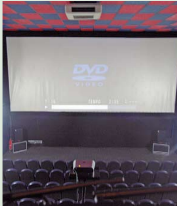
Na telona: programação com sucessos nacionais

A Subprefeitura Itaquera inaugurou no final de junho a sua própria sala de cinema. Desde dezembro funcionando no prédio do antigo Minishopping de Itaquera, a sala de cinema original foi reformada e entregue à população como um equipamento de lazer. A Sala de Cinema é uma parceria da Subprefeitura Itaquera com a Associação Cultural e Beneficente ABC Dinda, ONG que trabalha com projetos culturais para crianças e jovens, e com a Rede Brazucah, produtora cultural que até novembro vai ceder filmes nacionais para serem exibidos em duas sessões, períodos da manhã e tarde, sempre na primeira sexta-feira do mês. A entrada na Sala de Cinema é gratuita, porém é preciso agendar pelo telefone 2944-8626, ramais 2009 ou 2010.