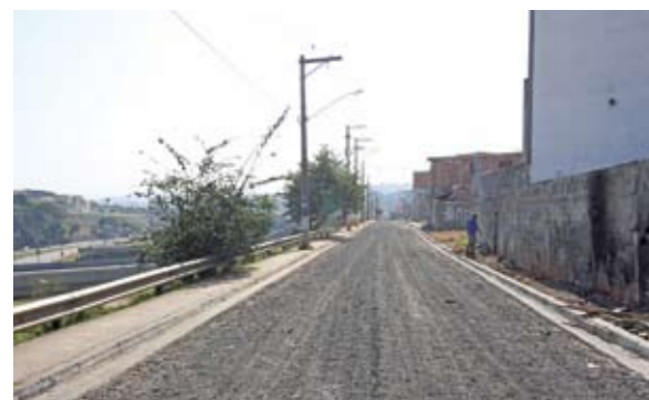
Pavimentação: o fim da lama e da poeira

Uma antiga reivindicação da população do distrito José Bonifácio começa a ser atendida. Localizada atrás da estação José Bonifácio da CPTM, a rua Agostinho Delgado de Arouche, que tem aproximadamente 300 metros de extensão, está sendo pavimentada. A colocação da base já foi concluída e nos próximos dias será colocado o asfalto.