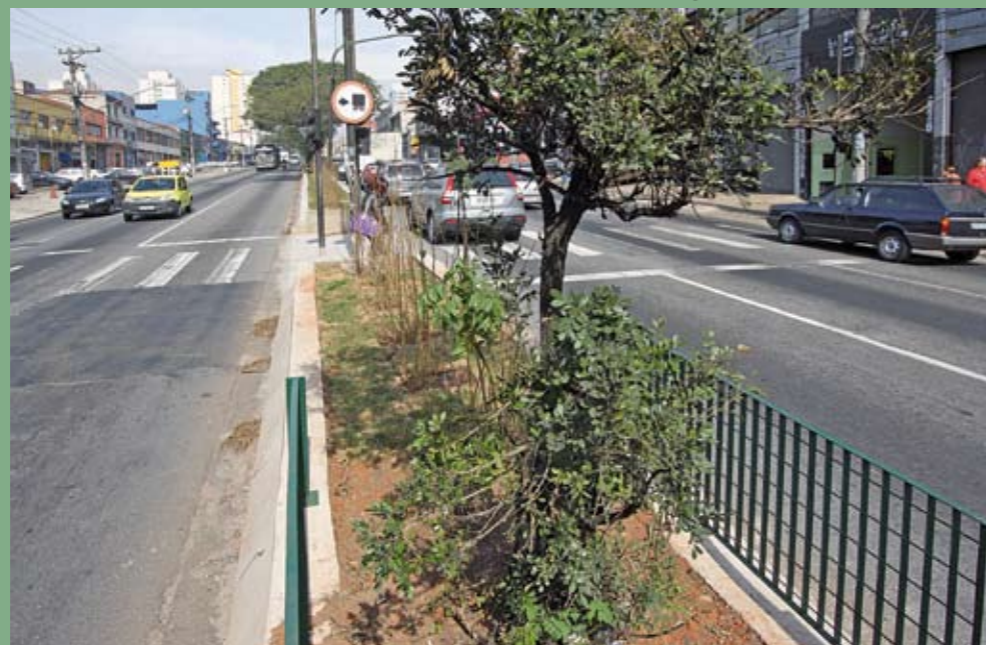
Canteiro central: guias elevadas evitam que carros cruzem a pista em acidentes. Grades protegem pedestres

M otoristas e pedestres já circulam com mais segurança pelo trecho urbano da Via Anchieta. O canteiro central foi reformado no trecho que vai desde a praça Gaúcha até a rua Ilíria. A guia, que antes era baixa, ganhou guarda-rodas de 56 cm de altura, o que impede, em caso de acidentes, que os veículos cruzem para o outro lado da via. Além disso, foram plantadas árvores e mudas de vegetação baixa. Os pedestres também ganharam mais segurança. Grades foram colocadas para impedir a travessia fora das faixas. Agora, serão instalados novos postes de iluminação.