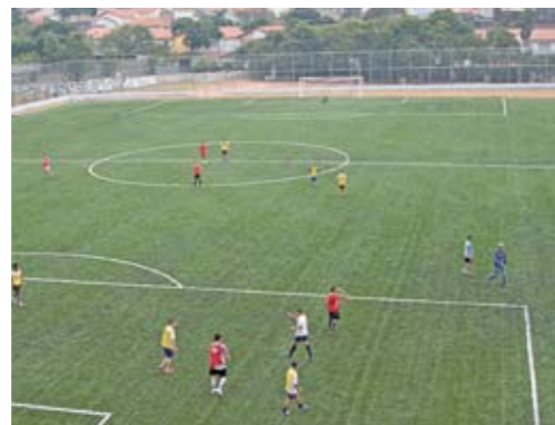
Grama sintética e dimensões de campo profissional

Os frequentadores do CDC Parque Fongaro ganharam mais uma razão para frequentar o clube: o campo de futebol foi reformado, com a colocação de grama sintética, alambrados e muretas novos. Agora, tem as mesmas dimensões de um campo oficial. O CDC tem também um campo de grama sintética de futebol society e quadras de futebol de salão e bocha. Fica aberto das 9h às 17h para atender ao projeto clube escola, do qual participam 250 crianças que recebem uniforme, lanche e aula de futebol. Das 19h30 às 22h30, a área fica para uso da comunidade. O endereço de lá é rua Prof. Syllas Baltazar de Araújo, 220. O telefone é 2351-0341.