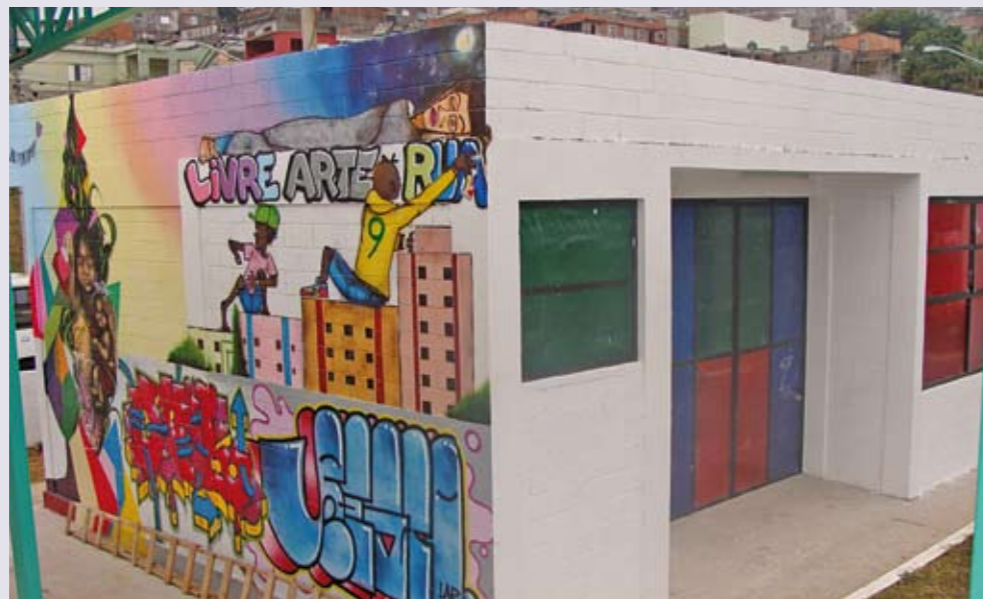
Centro Cultural: salas de leitura e oficinas e teatro

Para complementar as atividades da Estação da Juventude, que atende jovens entre 15 e 24 anos com atividades e cursos profissionalizantes na área cultural, acaba de ser concluída a construção do Espaço Cultural. Instalado em uma área de 190 m 2 , o novo prédio conta com sala de leitura, salas para realização de oficinas culturais e um teatro de arena com capacidade para 150 pessoas – além da recepção, área administrativa e banheiros, inclusive para portadores de necessidades especiais. O novo espaço fica na avenida dos Metalúrgicos, s/nº, ao lado do Terminal Velho de Ônibus.