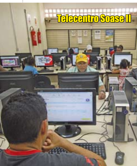
Telecentro Soase II