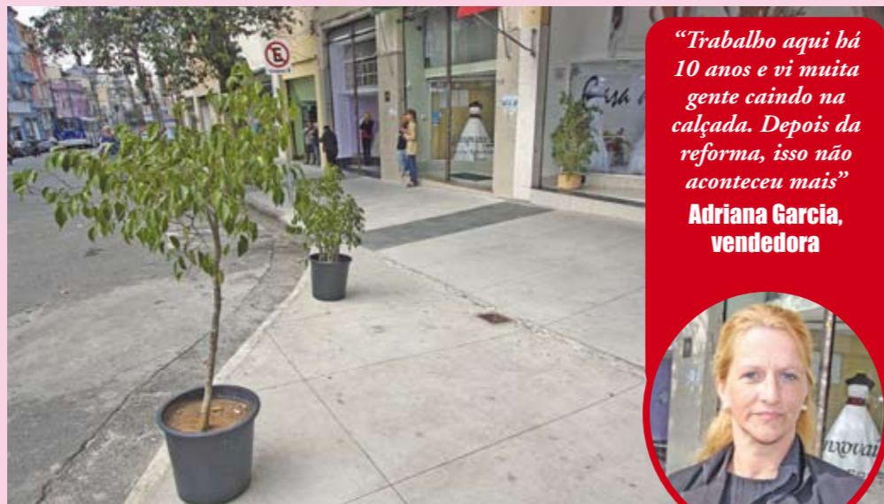
Calçada da rua São Caetano: 850 metros reformados

Quem vai à rua São Caetano, no Bom Retiro, em busca de produtos para casamento, ou quem circula diariamente pela região, nota que as calçadas estão bem melhores para caminhar. Os passeios entre a avenida Tiradentes e a rua Djalma Dutra, na chamada Rua das Noivas, acabaram de ser reformados pela Subprefeitura Sé. Os 850 metros de extensão foram padronizados em concreto, com faixa de ladrilho cinza. Além disso, foram colocadas rampas de acesso para quem tem mobilidade reduzida e piso podotátil nas esquinas.