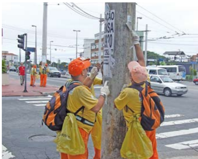
Equipe retira lambe-lambe do poste

O combate à pirataria, ao contrabando e à sonegação fiscal continua firme no centro da cidade. Os shoppings e as vias de grande movimento, como a avenida Paulista e a rua 25 de março, vêm recebendo fiscalização intensa. Essa é uma operação conjunta que envolve os governos federal, estadual e o município. Teve início em dezembro de 2010 e até agora já foram apreendidos cerca de 22 milhões de produtos falsificados ou contrabandeados. Cerca de 80 estrangeiros que estavam ilegalmente no País foram deportados pela Polícia Federal. Comprar e vender produtos contrabandeados ou piratados é crime previsto em lei, de acordo com o artigo 180 do Código Penal.